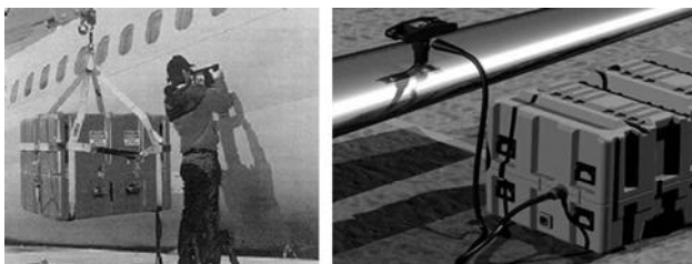
Рис. 3. Комплекс магнитно-импульсной рихтовки: а – фирмы "Electroimpakt"; б – фирмы "Fluxtronic"

Общими недостатками систем магнитно-импульсного притяжения, основанных на суперпозиции низкой и высокой частоты (как токов, так и полей!), являются наличие двух источников энергии, сложность требуемой силовой электроники, большие затраты на требуемые комплектующие и, как следствие, низкая надёжность в эксплуатации и достаточно высокая себестоимость конечного продукта.