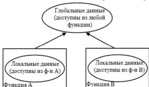
Рис. 1. Глобальные и локальные данные

проекта, которые являются наиболее важными. Любой функциональный модуль имеет доступ к глобальным данным. Схема, иллюстрирующая концепцию локальных и глобальных данных, приведена на рис. 1.