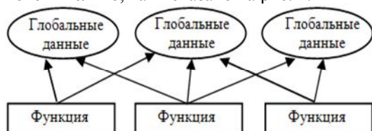
Рис. 2. Процедурный подход

Большие программы обычно содержат множество функциональных модулей и глобальных переменных. Проблема процедурного подхода заключается в том, что число возможных связей между глобальными переменными и функциональными модулями может быть очень велико, как показано на рис. 2.