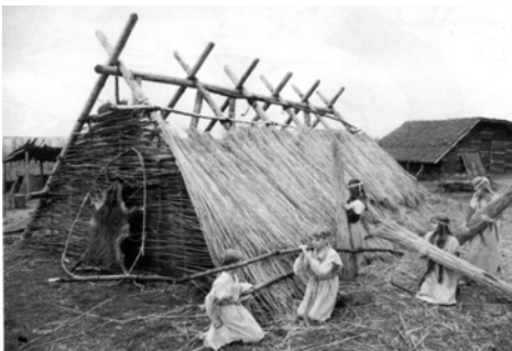
Рис. 4. Реконструкція житла кельтів у археологічному “скансені” “Альтаміра” (1986). За Й. Плейнеровою.

За ініціативи і безпосередньої участі Й. Плейнерової з 1996 р. розпочав функціонувати “археопарк” “Прага-Троя на Фарках”, де в 1974 р. було виявлене пізньогальштатське поселення доби раннього залізного віку.