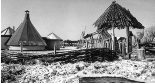
Рис. 3. Загальний вигляд археологічного “скансену” “Альтаміра” (1986). За Й. Плейнеровою.

тора Й. Варжека (Інститут етнографії та фольклористики, Прага), доктора В. Штайнохра (Відділ етнографії Національного музею, Прага) та місцевих жителів. Із 2006 р. ведуться роботи з реконструкції жител доби фракійського гальштату. У планах Й. Плейнерової є показати на прикладі досліджень у Бржезно історію стародавньої архітектури та побуту давнього населення Чехії від неоліту до пізнього середньовіччя [2] (рис. 1–2).