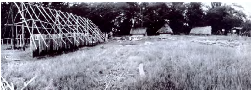
Рис. 2. На передньому плані реконструкція неолітичного житла в “Бржезно”. Фото Й. Плейнерової, 1999 р.

Археологічний “скансен” “Бржезно” був створений у