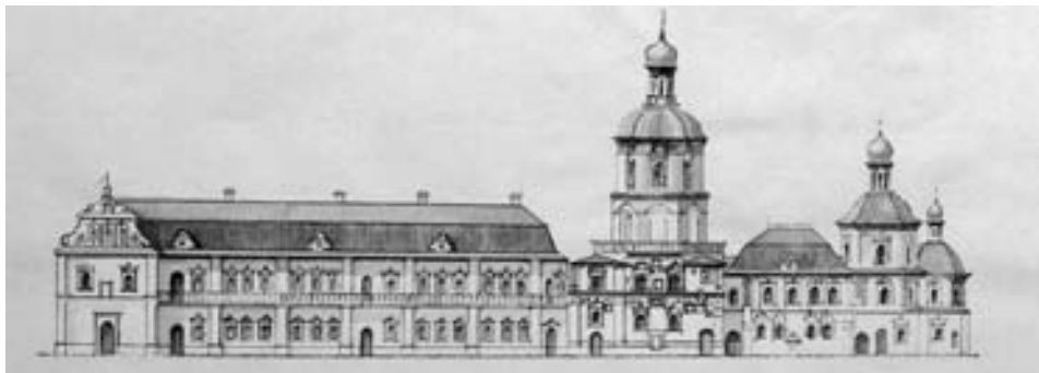
Чернігівський колегіум. Початок ХVІІІ ст. Реконструкція І. Ігнатенка.