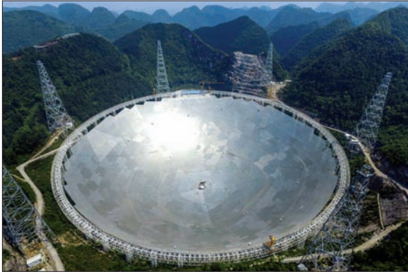
Рис. 1. 500-метровий радіотелескоп FAST (Китай, провінція Гуйчжоу)