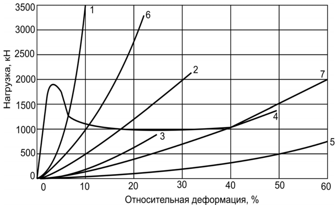
Рис. 1. Механические характеристики сборных опор различных конструкций: 1 - опора из БЖБТ с прокладками из ДСП; 2 - то же с прокладками из шпального бруса, уложенными в различных направлениях; 3 - то же с прокладками из шпального бруса, уложенными в одном направлении; 4 - костер из шпального бруса; 5 - костер из круглого леса; 6 - опора из БЖБТ с прокладками из распила; 7 - БЖБТ с прокладками из шпального бруса

Наиболее жесткую механическую характеристику имеют опоры с прокладками из ДСП. Использование в качестве прокладок шпального бруса снижает несущую способность конструкции, но обеспечивает большую податливость. При этом установлено, что укладка шпал в разном направлении в каждом последующем слое повышает несущую способность более чем в 2 раза, податливость также возрастает на 40-50%. Были использованы также прокладки из распила, уложенного в разном направлении в каждом слое.