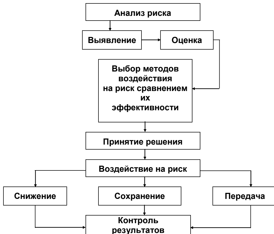
Рисунок 2 – Общая схема процесса управления риском

Алгоритм анализа профессионального риска для защиты персонала от несчастных случаев и профессиональных заболеваний на рабочем месте может быть представлен следующим образом (рис. 2):