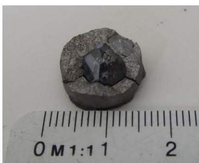
Рис 1. Монокристалл алмаза типа II b массой около 3 карат в ростовом объеме ячейки высокого давления АВД «Toroid-40»

Аналогичную по ростовому объему и способу создания температурного градиента ячейку высокого давления имеет АВД «Toroid-40» с диаметром центрального углубления в матрице 40 мм.