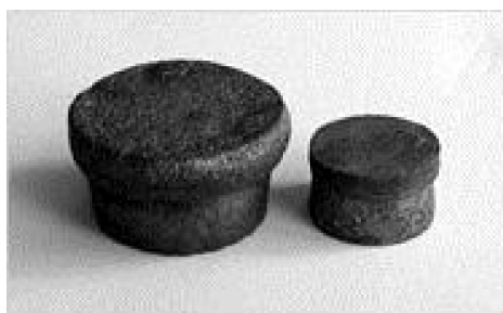
Рис. 3. Ростовые объемы АД «Girdle 40» (слева) и «Toroid 40» (справа)

Ранее была сконструирована и прокалибрована по давлению и температуре ростовая ячейка АД «Girdle-40» [13], предназначенная для выращивания монокристаллов алмаза, в которой для создания температурного градиента использовали применяемый в АД «Toroïd» и «БАРС» дифференциально-резистивный метод [14], позволяющий использовать для размещения ростового объема большую часть ячейки высокого давления (см. рис. 2). Этот метод предполагает использование в качестве нагревателей двух резистивных элементов (верхнего и нижнего нагревателей на рис. 2), позволяющих обеспечить необходимый осевой градиент температуры в зависимости от электросопротивления