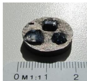
Рис. 4. Монокристаллы алмаза типа IIb, каждый массой около 3 карат в ростовом объеме ячейки высокого давления АД «Girdle 40»

Полученные результаты свидетельствуют о принципиальной применимости АД «Girdle» для промышленного выращивания монокристаллов алмаза методом температурного градиента, возможности повышения производительности этого производства при использовании АД «Girdle-40», а также перспективности применения в данном производстве АД «Girdle» с большим диаметром цилиндрического отверстия в матрице (см. таблицу).