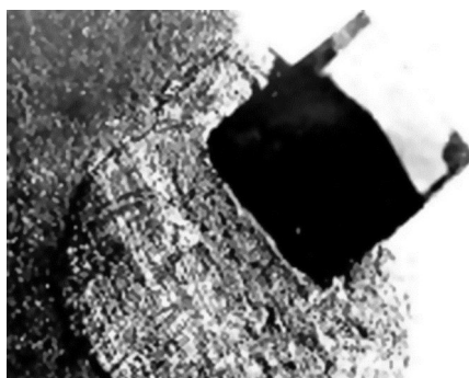
Рис. 1. Графитизация алмаза и растворение алмазного углерода в железе при нагреве в вакууме при 1150 °С