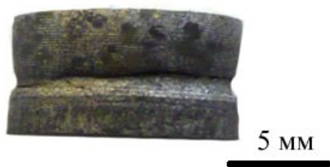
Рис. 2. Внешний вид боковой поверхности металла-растворителя после выращивания спонтанных кристаллов; длительность выдержки при температуре переохлаждения T_n – 10 мин (6 в таблице)

Общий вид металла-растворителя после выращивания с характерным распределением спонтанно сформированных кристаллов на его боковой поверхности представлен на рис. 2. Для этого образца (6 в таблице) длительность выдержки при температуре переохлаждения T_n составила 10 мин; начальная температура насыщения сплава углеродом T_1 = 1560 °С с выдержкой в течении 3 ч; после переохлаждения ростовой процесс возобновили при температуре 1480 °С с выдержкой в течении 43 ч; на боковой поверхности образца сформировались 20