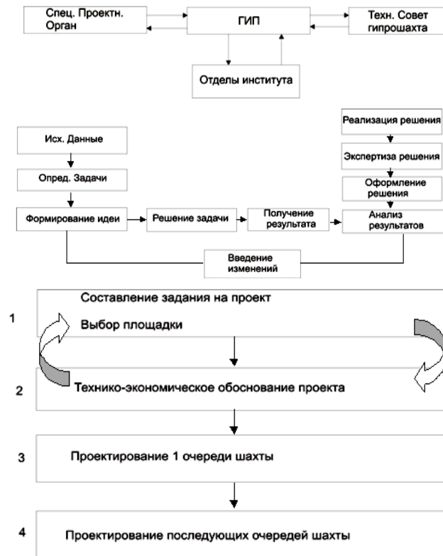
Рисунок 1 - Систематизация з проектування та планування гірничих робіт на нових горизонтах вугільних шахт і організація проектних робіт в 60-80-і роки ХХ століття