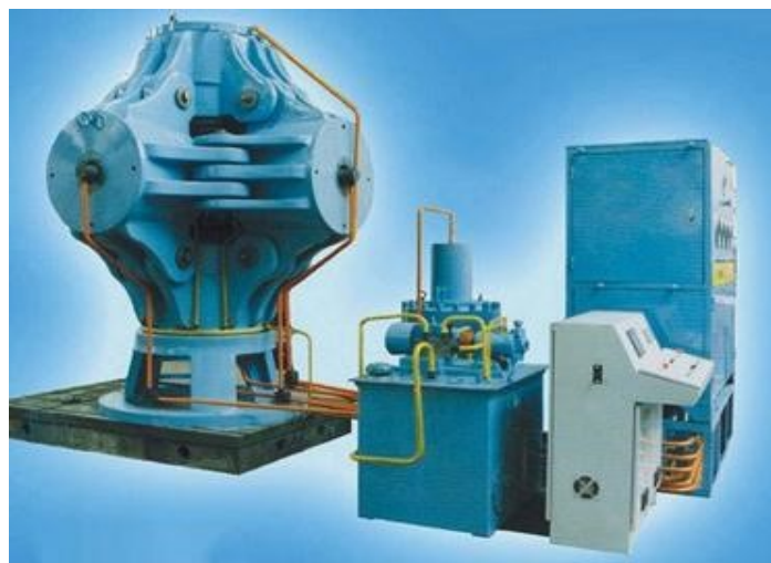
Рис. 1. Общий вид шестипуансонного пресса высокого давления ССР с маслостанцией, гидравлическим шкафом и панелью управления; габариты пресса – высота 3,1 м, максимальные поперечные размеры 2,7×2,7 м, общая масса 42 т, производство специализированного завода, г. Гулинь, КНР

Привлекателен для использования в целях выращивания высококачественных монокристаллов алмаза кубический пресс китайского производства (China cubic press – ССР). Аппаратуру этого типа в КНР начали производить в 1961 г. В результате создали высокоэффективный АД, позволяющий надёжно и стабильно создавать давление до 8 ГПа. Последние 10 лет такие аппараты применяют для производства шлифпорошков алмаза. Благодаря достаточно простой конструкции и большому рабочему объёму, в котором кристаллизуются алмазные порошки, эта аппаратура позволила совершить гигантский количественный скачок в производстве алмазных порошков и поликристаллов из них. Согласно данным китайских источников в 2012 г. с использованием таких аппаратов в Китае было выпущено более 12 миллиардов карат алмазной продукции. Китайская промышленность освоила производство ССР-аппаратов с диаметром плунжера 500–850 мм, что позволило проводить нагружение с до 60 МН (рис. 1).