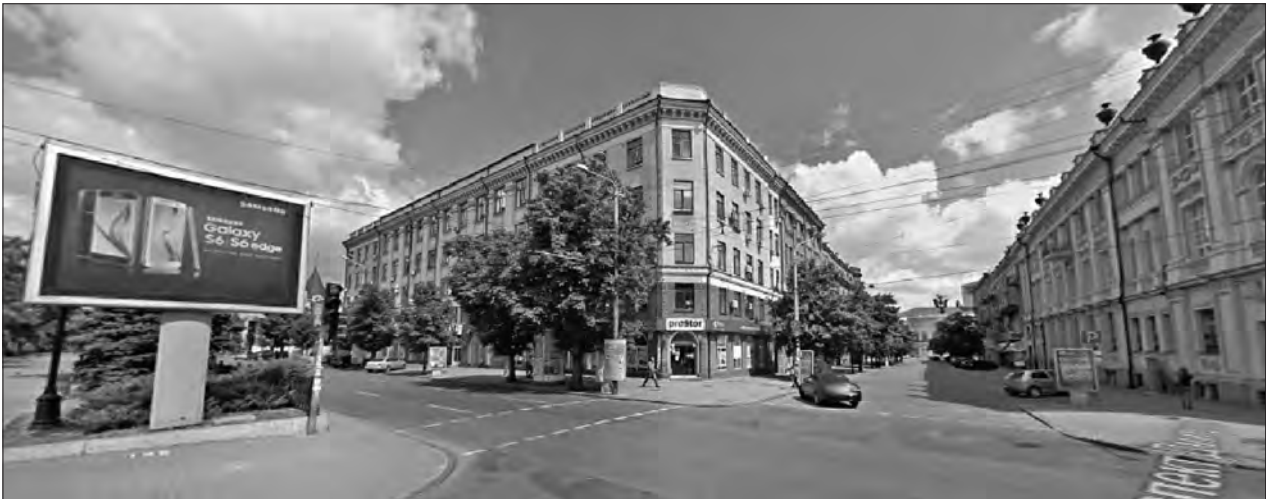
Рис. 1. Перехрестя просп. Д. Яворницького та вул. Воскресенська (фото)

ти результати охорони чистоти повітря і боротьби з шумом, отримані шляхом використання технічних удосконалень, що мають на меті обмеження рівня шуму і зменшення кількості відпрацьованих газів, що виділяються транспортними засобами. Радикальним засобом, що запобігає негативним наслідкам моторизації, є зміна принципів формування транспортних схем і забудови, що застосовувалися донині. Необхідним є істотне просторове відділення територій, призначених виключно, або головним чином, для пішохідного руху (територій центрів), від територій, призначених тільки, або головним чином, для руху транспорту. Транзитний рух слід проводити виключно за межами території центру міста. Це питання детально розглянуто в роботі [13].