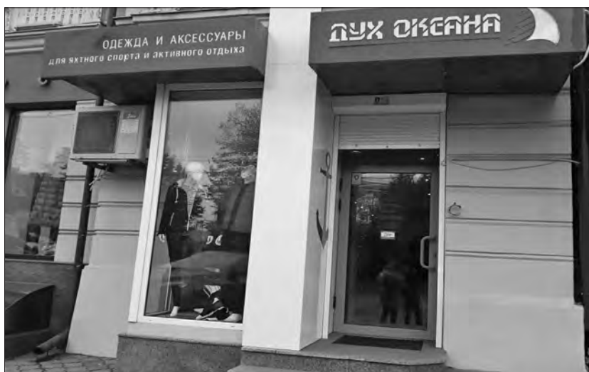
Рис. 3. Наявність зовнішніх блоків кондиціонерів на фасадах будівель: а – торговельна точка з зовнішнім блоком кондиціонера; б – банківські установи з зовнішніми блоками кондиціонерів