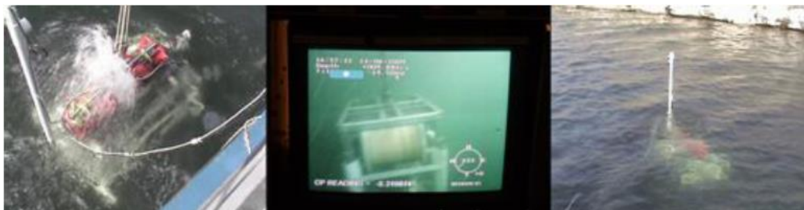
Рис.1. Исследовательский робот подводного базирования Консорциума BALTROBOTICS

таких вулканов на этом континенте, из которых один вулкан извергался в XIX столетии, два извергались в XX столетии и два – в XXI столетии [1].