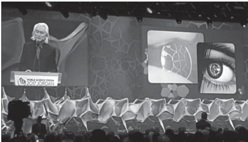
Выступление Митио Каку

Всемирный научный форум 2017 года рассмотрел важнейшую взаимозависимость воды, энергии и продовольствия как наиболее острую проблему для мира и безопасности. В частности, в Иордании и на Ближнем Востоке нехватка воды создает серьезную угрозу стабильности. Ученые и научные дипломаты играют центральную роль не только в разработке технологий и систем управления, но и в укреплении сотрудничества, институтов и обмена знаниями; улучшении водосбережения и энергоэффективности; создании местного потенциала; обеспечении устойчивости путем совместного управления трансграничными ресурсами. Наука предлагает