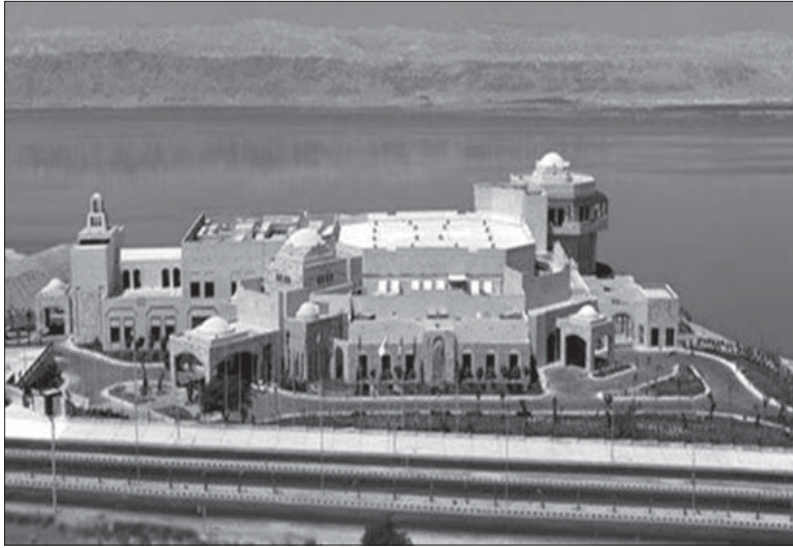
Центр короля Хусейна бин Талала

мнениями и обсудить различные научные проблемы. Среди них: искусственный интеллект, глобальные пандемии, научная дипломатия, международное научно-техническое сотрудничество, безопасность и сельское хозяйство, арабские женщины в науке, ученые-беженцы, энергетика и вода, изменение климата, устранение бедности и неравенства, взаимопонимание между народами и др.