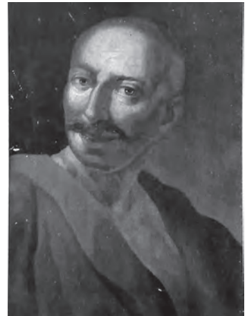
Ілюстр.3 Я.Сваричевський Портрет Івана Гонти (?–1768 рр.) Копія 1880-х рр. з оригіналу ХVІІІ ст. для колекції О.Лазаревського НМІУ. – №М-142; пол., ол., 52x38 см