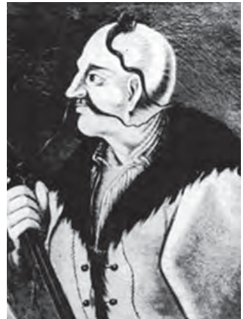
Ілюстр.4 Невідомий художник Іван Гонта (?), 1822 р. ДнНІМ, №КП-5402, Х-919, пол., ол., 55x48 см Публ.: Україна – козацька державна. – К., 2007. – С.227