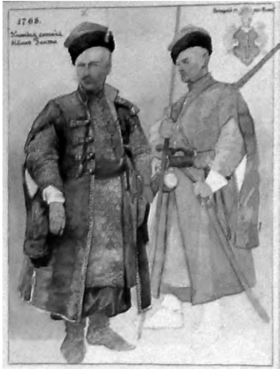
Ілюстр.2 А.Ждаха. Іван Гонти. Альбом «Україна та Запорозжя». – №5 Напис ліворуч згори: «1768 / Уманск. / сотник Іванъ Гонта», праворуч: «Потоцькій гр. гер. «Pilawa» Ескіз, папір, олівець, акварель Публ.: Україна – козацька держава. – К., 2007. – С.228