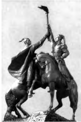
Ілюстр.4 І.Гончар. Макет скульптурної групи «Ватажки Коліївщини» для пам'ятника в Умані, 1968 р.