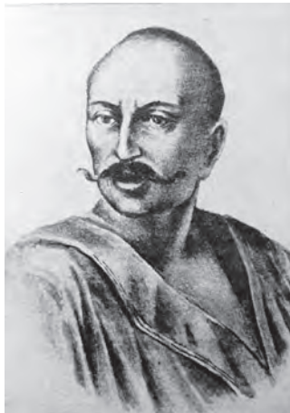
Ілюстр.2 Невідомий художник Портрет Івана Гонти Публ.: Грушевський М. Ілюстрована історія України. – С.416, №361 (походження не вказане)