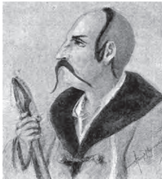
Ілюстр.2 Невідомий художник Публ.: Gloger Z. Encyklopedia Sta- ropolska Ilustrowana. – Т.II. – S.229