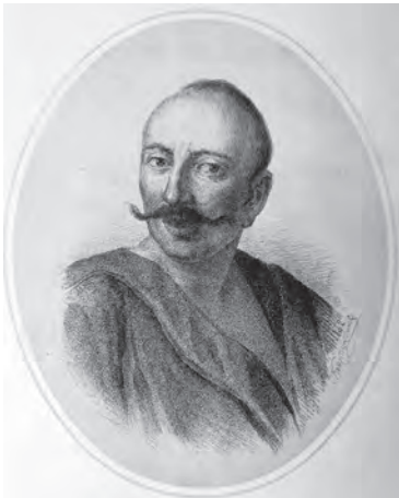
Ілюстр.1 Константинов (?) Іван Гонти ІР НБУВ. – Ф.292. – Спр.140 Перебував у колекції В.Антоновича Публ.: Киевская старина. – 1882. – №11