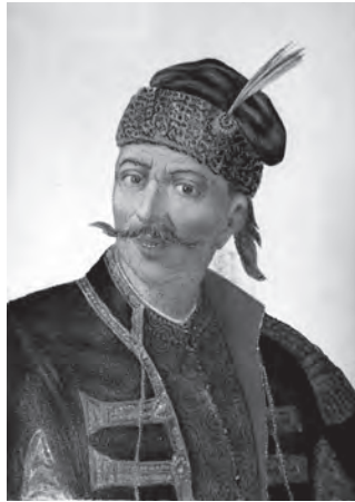
Ілюстр.5 Невідомий художник Уманський сотник Іван Гонта ІР НБУВ. – Ф.292. – Спр.141 Публ.: Аркас М. Історія України- Русі. – С.344