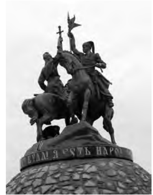
Ілюстр.6 І.Зарічний. Пам'ятник герою Коліївщини в Умані, за макетним проектом І.Гончара, 2015 р.