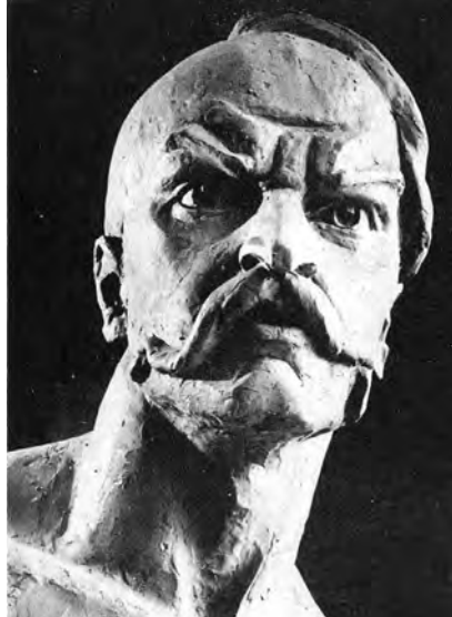
Ілюстр.8 І.Гончар. Погруддя І.Гонти, 1971 р.