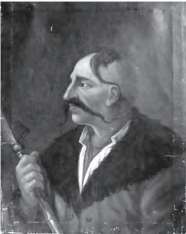
Ілюстр.1 Невідомий художник Іван Гонта. XIX ст. НМІУ, М-133