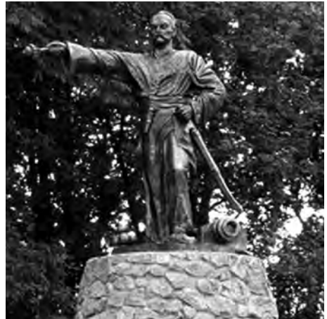
Ілюстр.10 В.Сулима. Пам'ятник Івану Гонті у м. Христинівка Черкаської обл. Відкритий 24 жовтня 2009 р.

The article investigates the reasons of correspondences/differences between real and imaginary image of I.Gonta fixed in the narrative and visual sources of 18–19 centuries. The present article analyses the impact of distorted images onto formation of modern iconography of this historical figure. It is also demonstrated how through visual space markers, i.e. monuments, the images that have nothing in common with the actual figure of the past are consolidated in historical perceptions and awareness of contemporary people.