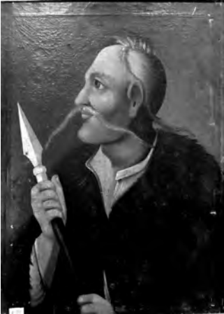
Ілюстр.5 Невідомий художник Портрет Гонти. XVIII ст. НХМУ, Ж-971, пол., ол., 73x59,5 см