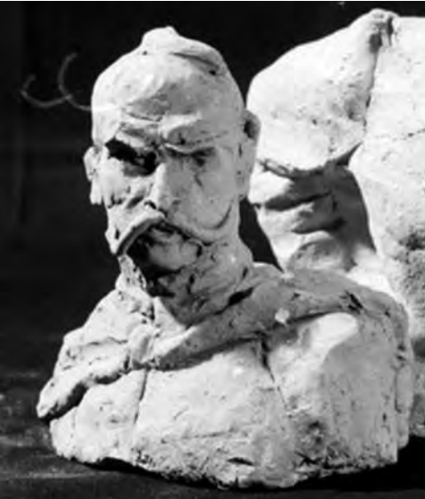
Ілюстр.7 І.Гончар. Погруддя І.Гонти, 1960-ті рр. (робочий макет)