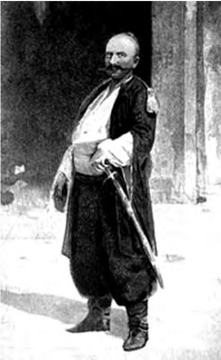
Ілюстр.1 С.Васильківський. Уманський сотник Іван Гонта. Акварель Публ.: Из украинской старины: С рисунками С.Васильковского и Р.Самокиша, текст Д.Эварницкого. – Санкт-Петербург, 1900