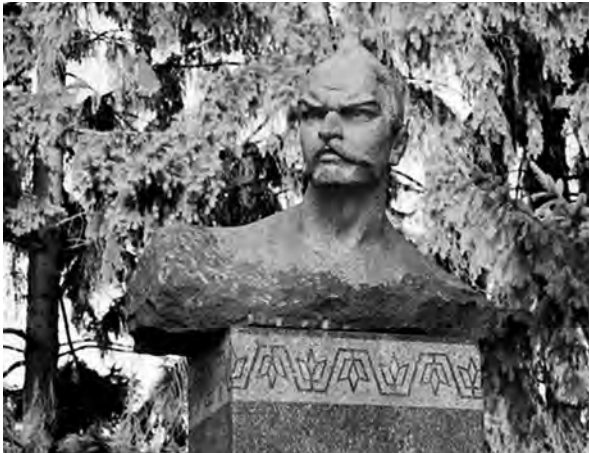
Ілюстр.9 І.Гончар. Погруддя І.Гонти, 1971 р. Встановлено у с. Гонтівка Вінницької обл. у 1971 р. На постаменті є пам'ятна таблиця зі словами: «В селі Гонтівці Могилів-Подільського району в 1768 році був страчений один із ватажків антифеодального національно-визвольного повстання українського народу (Коліївщина) Іван Гонта»