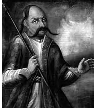
Ілюстр.7 Невідомий художник Гайдамака (Іван Гонта?), XVIII ст. НМЛ, №Ж-222, пол., ол., 77x60 см Публ.:Україна – козацька держава. – К., 2007. – С.224