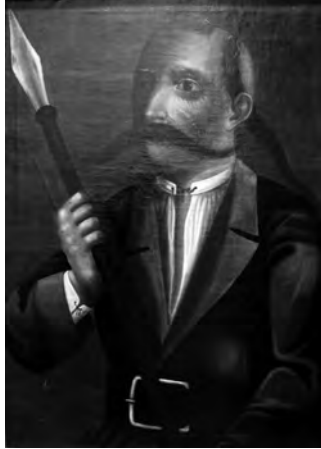
Ілюстр.6 Невідомий художник Портрет Івана Гонти, XIX ст. НХМУ, Ж-669, пол., ол., 71x57,5 см