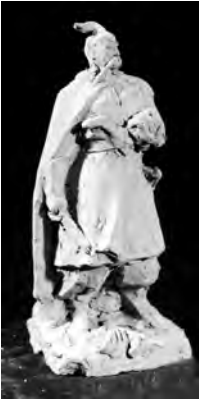
Ілюстр.3 І.Гончар. Макет постаті І.Гонти для пам'ятника в Умані, 1968 р.