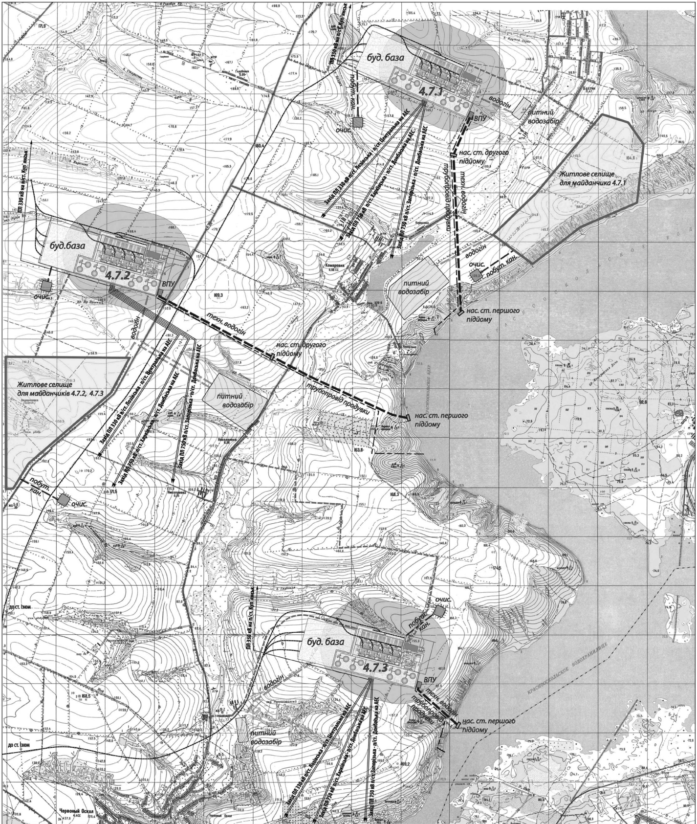
Рис. 4. Северная АЭС. Червонооскільський пункт: 4.7.1, 4.7.2, 4.7.3 — номера площадок пункта Червонооскільський