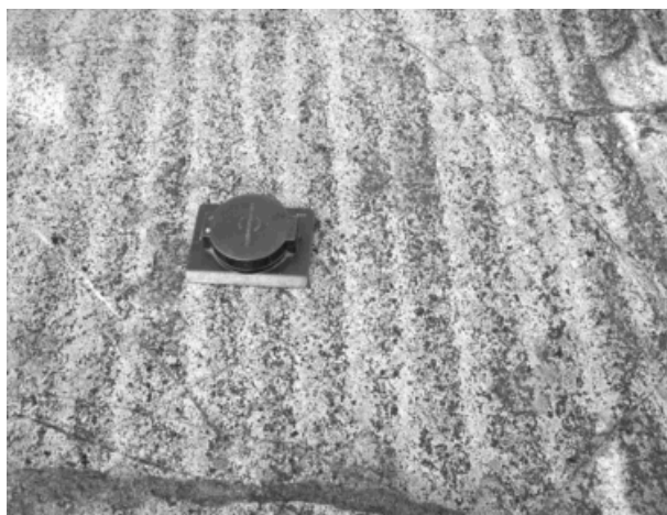
Рис. 1. Ритмическая расслоенность крупнозернистых габброидов в СЗ части о. Питерман

Расстояние между серединами смежных темных слоев составляет около 5 см. Границы между слоями неровные, зубчатые. Сходное строение имеет дюймовая полосчатость, описанная Хессом в массиве Стиллуотер (Уэйджер, 1970), однако выявленная нами расслоенность габброидов характеризуется разной шириной темных и светлых полос и большими расстояниями между темными полосами. Полосчатые габброиды прорываются массивными среднезернистыми габброидами более поздней интрузивной магматической фазы.