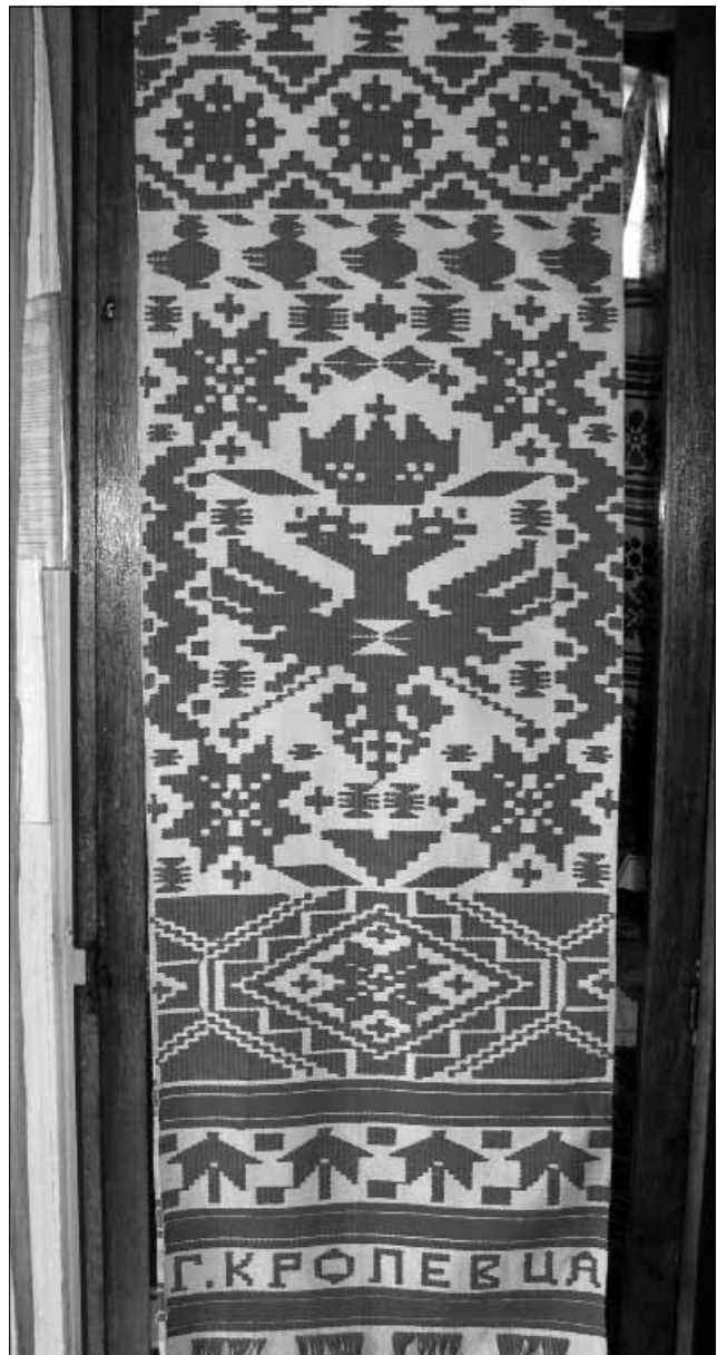
Рушник тканий «Кролевецький» (Т-11382. КВ-38826) м. Кролевець, Чернігівщина, друга половина ХІХ ст.

Рушник тканий. «Кролевецький». Затканий червоним. Чернігівщина. Поч. ХХ ст. Знайдено: с. Полтавський Бобрік, Гадяцький р-н, Полтавська обл. Композиція: гори-