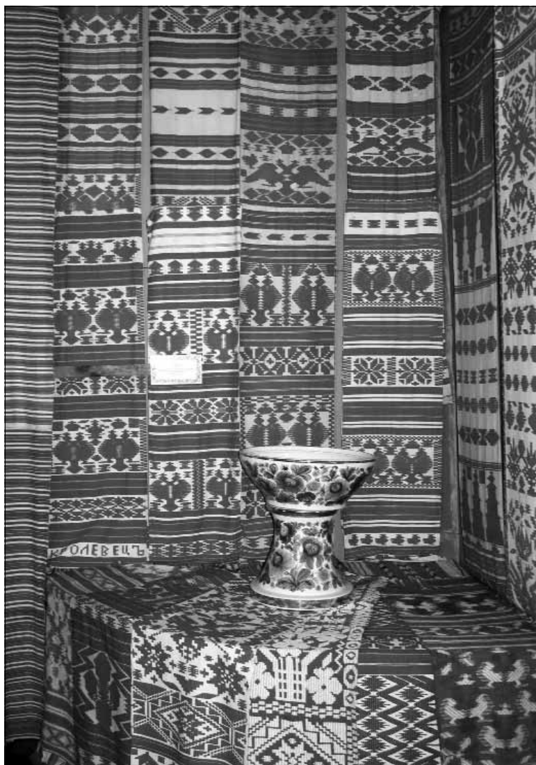
«Кролевецькі» рушники в експозиції Музею українського рушника НІЕЗ «Переяслав»

Рушники, вироблені на кролевецьких мануфактурах, у експозиції Музею українського рушника складають невелику частину фондового зібрання Національного історико-етнографічного заповідника «Переяслав» (надалі у тексті ДІЕЗ «Переяслав») – всього 47 одиниць. Але треба відмітити, що у збірці українських народних рушників кролевецьких налічується понад триста одиниць.