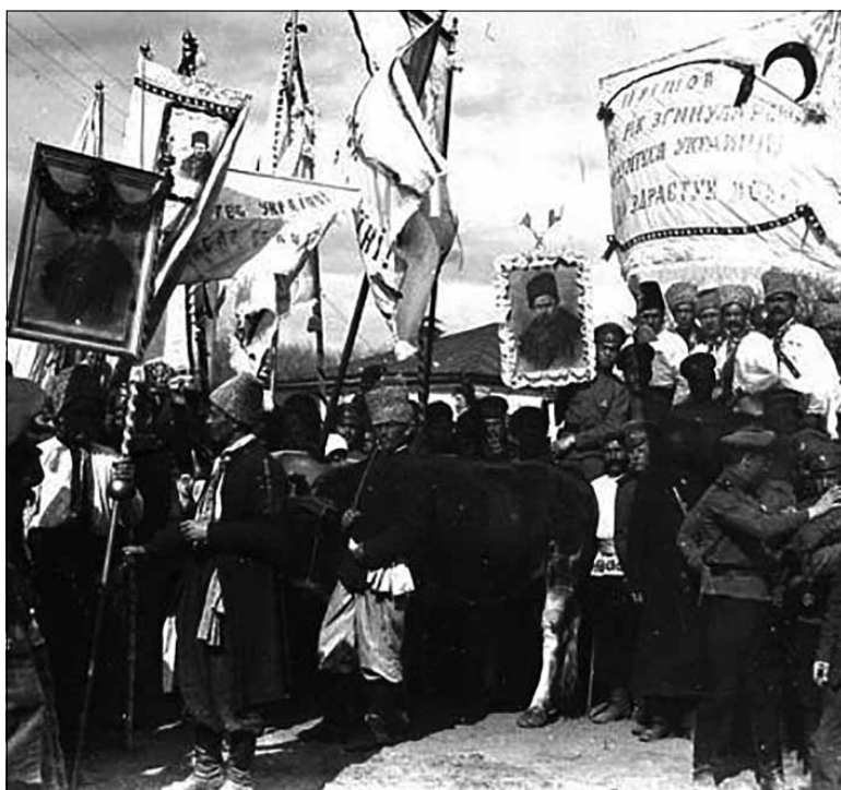
Український гурток Шостки на маніфестації 1(14) травня 1917 р.