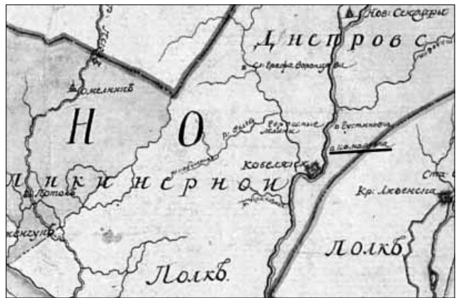
Рис. 3. Комарівка у складі Дніпровського пікінерського полку на Приблизній генеральній карті Новоросійської та Азовської губерній, 1775 р. Фрагмент