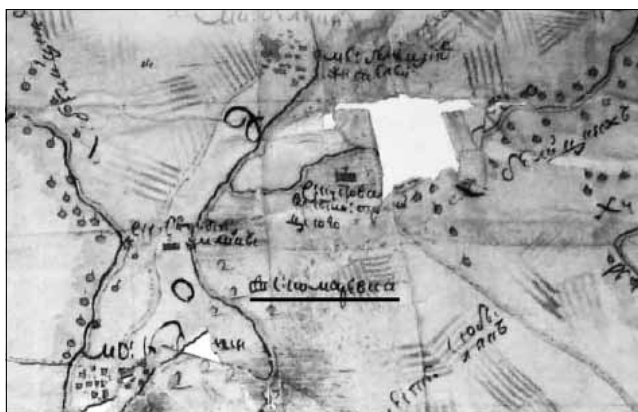
Рис. 2. Комарівка на карті Єкатерининської провінції, 1765 р. Фрагмент