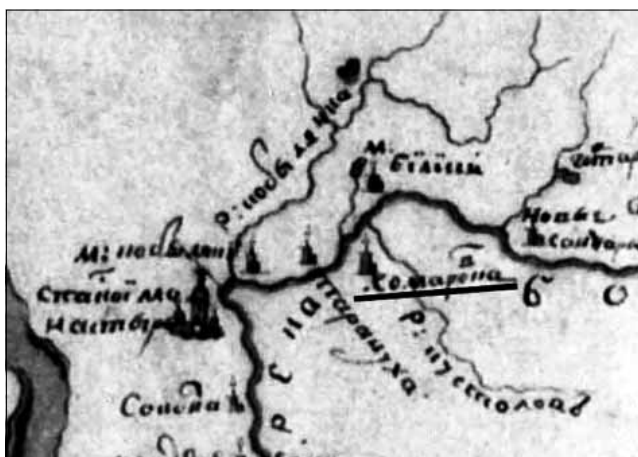
Рис. 1. Комарівка на Достовірній ландкарті межі рік Дніпра і Дінця, 1750 р. Фрагмент