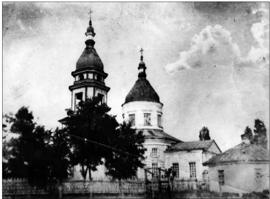
Рис. 5 Михайлівська церква у с. Комарівка. Фото між 1862–1930-ми рр.

Свідчення про втрати хатнього начиння дозволяють скласти уявлення про елементи інтер'єру сільського житла. На жаль, не повідомляється про планування