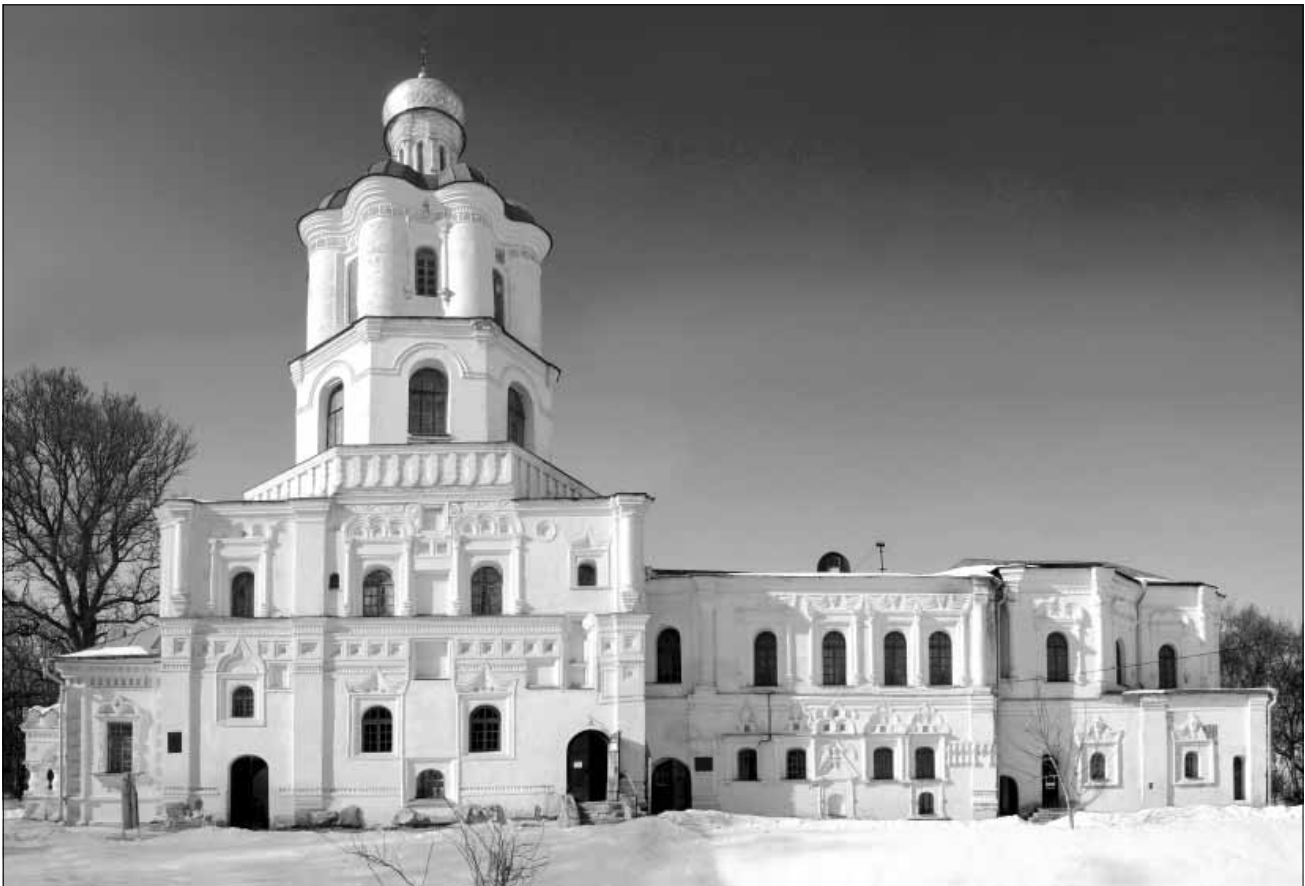
1. Будинок Чернігівського колегіуму. Поч. XVIII ст.

Насамперед, побудували величну сорокаметрову дзвіницю, верхній ярус якої немовби скульптурно виліплений з восьми могутніх напівциліндрів, увінчаних фризом розеток та широким карнизом. Над входом до дзвіниці знаходилася закладна керамічна дошка з гербом гетьмана Івана Мазепи, що збереглася до нашого часу, і напис на якій свідчить, що дзвіницю було збудовано у 1700–1702 рр. «прещедрим даянием и иждевением» ясновельможного гетьмана. На її верхньому поверсі знаходилася церква в ім'я Іоанна