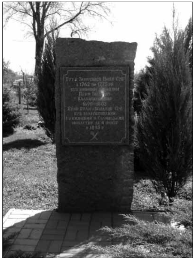
Пам'ятний знак про кошового отамана Нової Січі П.І. Калнишевського, с. Покровське Нікопольського району. Встановлений в 1990 р. Фото 2013 р.

Найважливішим джерелом для здійснення вищевказаного є опублікований А.О. Скальковським «План Нової Сечи в настоящем виде в с. Покровском». На ньому він схематично в масштабі 1 дюйм = 100 сажнів (при публікації книги його не було дотримано – прим. автора) позначив Покровську церкву (А); паланку або внутрішній Кіш (В); передмістя – Шамбаш або Гассан-баша (С) (розташований на північ від укріплень Січі – прим. автора); С – Брату на в'їзді в зовнішній Кіш; Д – Кіш (нині городок); Е – Новосіченський ретраншемент; Б – уступ або затоку, тобто порт; в – нинішнє село Покровське; Н – старий цвинтар (на плані їх було позначено два –