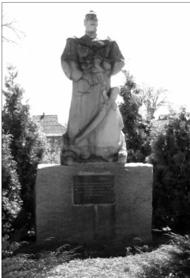
Пам'ятний знак про кошового отамана Нової Січі П.І. Калнишевського, с. Покровське Нікопольського району. Встановлений в 1990 р. Фото 2013 р.

XX ст. після ухвалені 16 липня 1926 р. спільної постанови ВУЦВК та РНК Української СРР «Положення про пам'ятки культури і природи». На території Нікопольського краю розпочалася робота по здійсненню пам'яткоохоронних заходів. Після їх проведення Український комітет з охорони пам'яток матеріальної культури при Наркоматі освіти УСРР 23 липня 1927 року зареєстрував такий об'єкт у селі Покровському – «Покровська Нова Січ 1734–1775 рр. (необхідні охоронні заходи – консервація і нагляд, вивчення шляхом розкопок)» [46, с. 1].