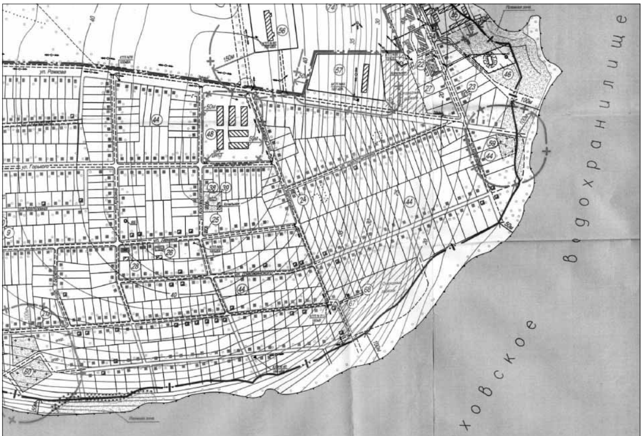
Изменение к генеральному плану с. Покровское Никопольского района Днепропетровской области. 11-088-0-ІП. М 1:5000. 2011 г. (фрагмент)