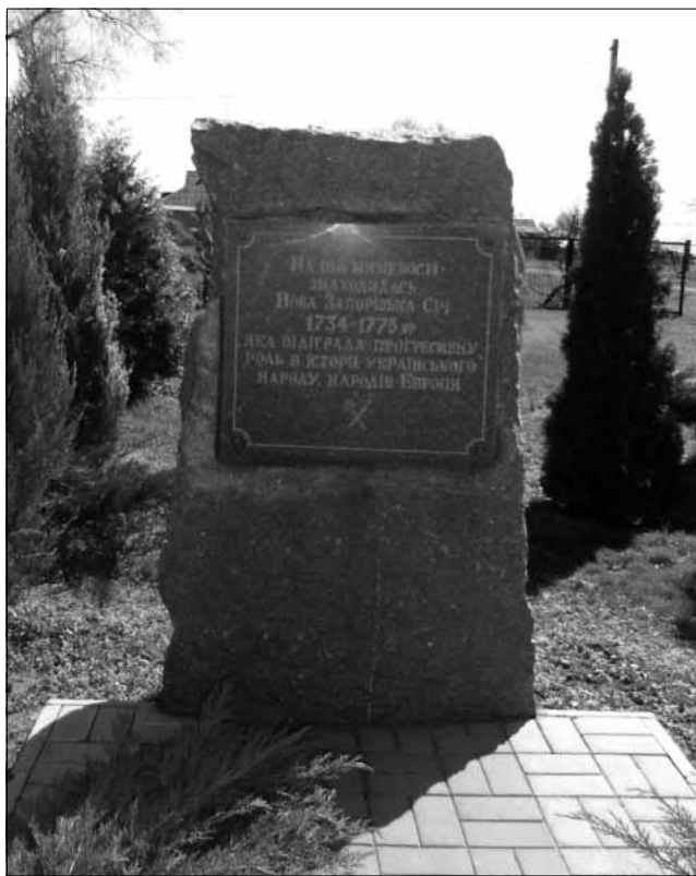
Пам'ятний знак про Нову Запорозьку Січ (1734–1775 рр.), с. Покровське Нікопольського району. Встановлений в 1990 р. Фото 2013 р.

го Коша та Гассан-Баші і були своєрідними орієнтирами меж території Нової Січі. За результатами досліджень Т. Кузик, ймовірно, у них було поховано декілька тисяч померлих запорожців [25].