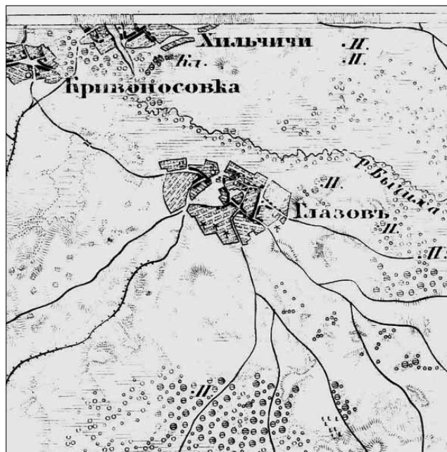
Рис. 1. Фрагмент «трёхверстной» карты Російської імперії (1863 рік)

Через маловивченість теми існує деяка плутанина з визначенням часу першої згадки про с. Глазове. Все