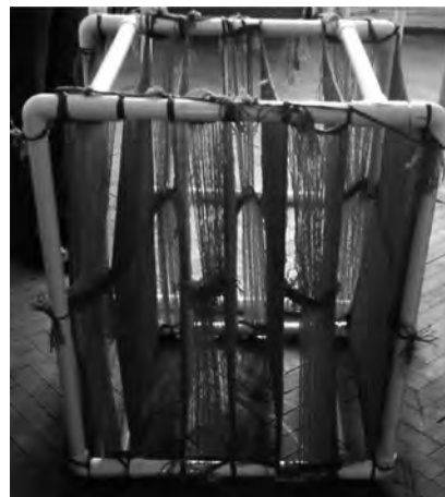
Устройство для иммобилизации ANAMMOX-бактерий.

щью устройства, каркас которого изготовлен из поливинилхлоридных труб (рисунок).