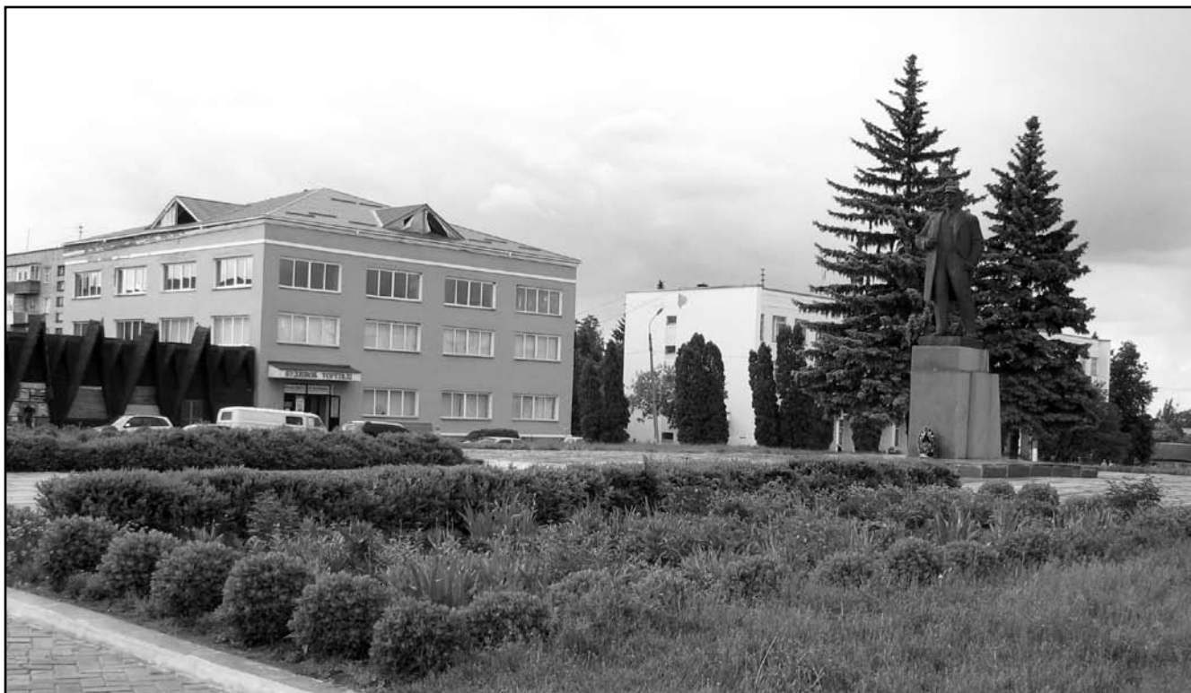
Рис. 1. На цьому місці знаходився будинок, у якому з 1933 р. до 1935 р. розмішувалася крамниця «Торгсин» у Глухові. Фото автора, 2010 р.

про співробітників системи переважно стосується часу перебування їх на роботі в торговому пункті, а також фрагментарними даними про рік народження, походження, освіту, партійну приналежність, наявність чи відсутність доган та покарань. Подальша ж доля персоналу системи залишається, як правило, невідомою.