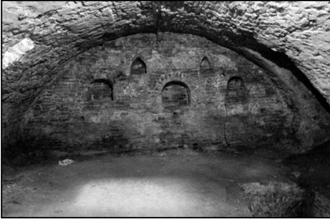
Рис. 2. Реликварий в западной стене храмового підземного помешчення (под корпусом XVI в. «На погребях») Спасо-Преображенського монастиря Новгород-Северського, Україна. Фотографія автора, 2010 г.

форму монашества можно реконструировать, скорее, по рассказу «Повести временных лет» о пещерной кельи Илариона, в которой поселился преподобный Антоний, вернувшись на Русь с Афона, и предполагать, что первичной формой русского монашества было пещерное отшельничество.