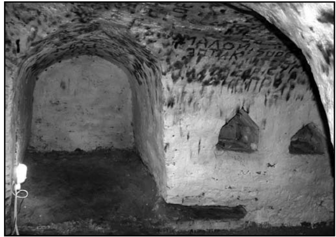
Рис. 1. Крупногабаритная ниша-келья в подземном храмовом помещении (под корпусом XVI в. «На погребках») Спасо-Преображенского монастыря Новгорода-Северского, Украина.

В «Слове о законе и благодати» митрополита Киевского Илариона (1037-1043 гг.) в Похвале кн. Владимиру говорится: «монастыреве на горах стаща, черноризьци явишася» [10, 93], что соответствует сведениям