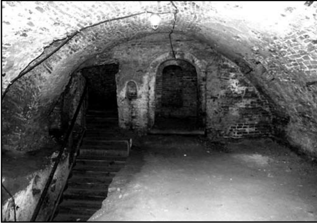
Рис. 4. Вид на алтарную часть подземного храма (под корпусом XVI в. «На погребях») Спасо-Преображенского монастыря Новгород-Северского. 2010 г.

под редакцией преосвященнейшего Филарета Гумилевского на страницах Черниговских епархиальных известий в 1861 г. [5]. Архимандрит Венедикт отмечает даты основания Спасского монастыря, предложенные Шафонским (1033 г.), и предание об основании обители Ярославом Мудрым в 1036 г., как «сказания, не имеющие исторического основания, и потому недостоверные. Гораздо несомненное то, что монастырь сей основан в то время, когда Новгород-Северск сделался славою городов, входивших в княжение Северское, и столицю особых удельных князей, потому что в 1787 году, при разборе в сем монастыре древней каменной Преображенской церкви, для построения новой, в основании ее найден овальный камень, резная надпись которого показывала, что строителями сей церкви были Владимир и Изяслав Давидовичи, первые князья Новгород-Северские, внуки Святослава Ярославича, князя черниговского, владевшие Новгород-Северском с 1127 по 1136 год» [5, 33].