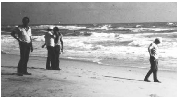
Фото 5. На переднем плане слева – черные титаноносные пески в волноприбойной зоне экваториального побережья Индийского океана (район порта Кисмаю). Январь – февраль 1977 г.

тяжностью 500–700 м, секущими переслаивающиеся сланцы и кварцито-песчаники серии Инда Ад.