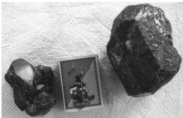
Фото 4. Касситерит из месторождения Далан: монокристаллы из пегматита (справа) и друза из кварцевой жилы, вскрытой штольней (слева). Масштаб – спичечный коробок (в центре)