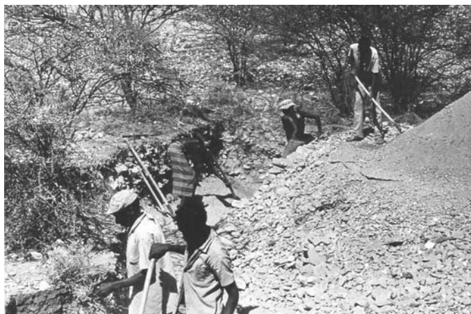
Фото 3. Ручная рудоразборка дезинтегрированных оловорудных пегматитов; слева — сомалийский рабочий с обломком кристалла касситерита

стоятельное знакомство с малоизвестным оловорудным районом и названными месторождениями (фото 1–4).