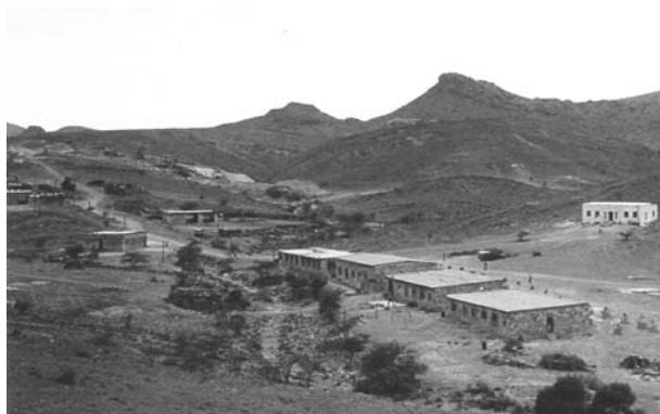
Фото 1. Месторождение Маджиян. Дальний план — серия Инда Ад в поднадвиговой зоне (ниже двух вершин); передний — сохранившаяся база итальянской компании «Комина»