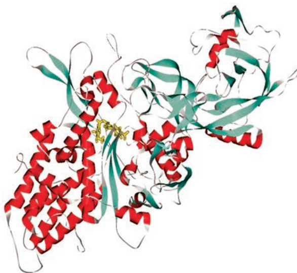
Рис. 3. Модель комплексу лейцил-тРНК-синтетази Mycobacterium tuberculosis з інгібітором

У результаті тестувань було відібрано 59 речовин, які найбільшою мірою пригнічували розвиток патогенних бактерій, причому не