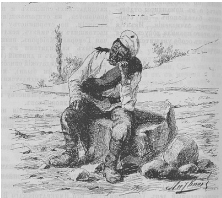
Фото. 2. Відстав 27

Загалом задоволення військовими своїх фізіологічних потреб у їжі під час бойових дій, польових навчань, походу чи на марші, на нашу думку, не можна вважати достатнім. Річ у тім, що для таких випробувань необхідно було мати неабияку фізичну силу і витривалість. Під час значних фізичних перевантажень мало хто звертає увагу на процес приготування страв. Завдяки віднайденому нами зображенню відсталого солдата на марші, можемо побачити, наскільки вимотували людей військові переходи (див. фото 2).