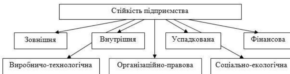
Рис. 1. Види стійкості сільськогосподарських підприємств в економічному аспекті