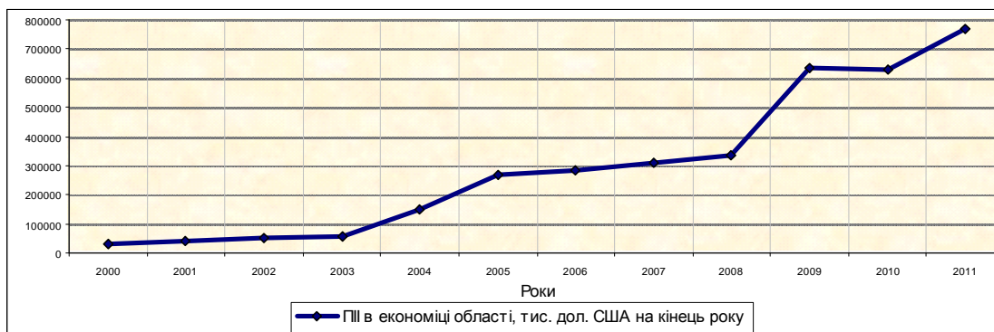
Рис. 2. Динаміка прямих іноземних інвестицій в економіку Луганської області за 2000 – 2011 рр. [5]