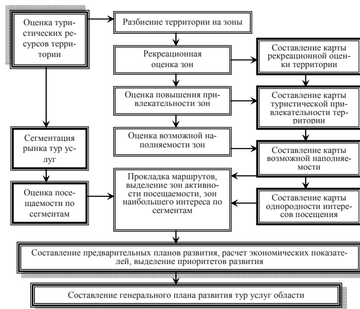
Рис. 1. Процесс организации сравнительной оценки привлекательности промышленной территории для развития въездного и внутреннего туризма

Украине требуют своего совершенствования. В настоящее время исследованы отдельные стороны оценки рекреационных территорий, результаты которых не позволяют утверждать, что сформулированные методы и методология по комплексной оценке рекреационных ресурсов адаптированы к условиям рыночных отношений. Возникла необходимость проведения дополнительных исследований, учитывающих трансформационные процессы, происходящие в экономике Украины.