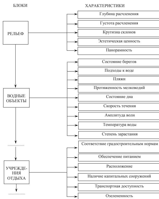
Рис. 2. Рекреационные оценочные блоки и их характеристики

После выбора соответствующих характеристик и блоков вторым этапом методологии является качественная оценка объектов. Как принято, характеристики различных показателей объекта оцениваются по трем категориям: «благоприятно», «относительно благоприятно», «неблагоприятно». В некоторых случаях может