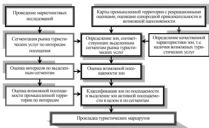
Рис. 4. Процесс оценки посещаемости зон по интересам туристов (детализация фрагмента организации сравнительной оценки привлекательности промышленной территории)

Прокладку перспективных туристических маршрутов, определение зон активного посещения и т.п. рекомендуется проводить на основе сопоставления тенденций развития туристических потребностей и выявленной привлекательности территории в комплексе с предельно допустимой нагрузкой.