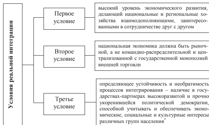
Рис. 1. Основные условия реального интегрирования государств или их регионов

На рис. 1 представлены три основных условия реального интегрирования.