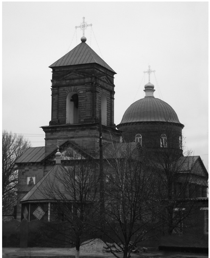
Церква в сусідньому селі Михайлівці, куди приходила родина Грінченків.

Образ національного світу – перший етап у формуванні свідомості дитини. У Б.Грінченка немає визначення цього поняття, як і «національний образ світу», але шляхом наукової реконструкції, опираючись на сукупність його філософських, педагогічних, психологічних поглядів, можна було б сформулювати їх так: образ національного світу – це відображення людиною тих соціально-етнічних, духовних, природних умов життя, в яких вона живе, усвідомлює, оцінює і виявляє себе як особистість, як представник свого народу. В національному образі світу відбивається не стільки предметна сторона дійсності, скільки духовно-моральна позиція особистості у ставленні до того, що його оточує, і як представника етносу, і як «члена людської сім'ї». В національному образі світу соціум, природа і сама людина проходять через призму національних цінностей та ідеалів, які сформувалися історично і закріплені у мові та культурі народу. Цілісний образ світу як загальнолюдський, загальнокультурний феномен включає в себе два попередніх. Через національне дитина