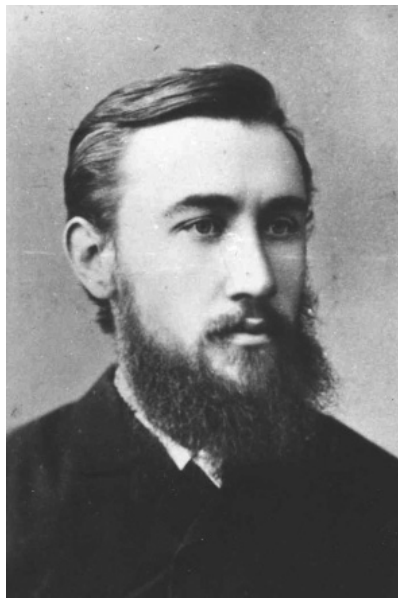
Б. Грінченко. 1880-ті роки.

У «Листах з України Наддніпрянської» Борис Грінченко один з перших дає правдиву оцінку творчої спадщини Тараса Шевченка як письменника, насамперед, національного, що перший виразно висловив ідею незалежності української нації, тому в українській літературі «не буде вже ні одного рівного йому своїм значенням у справі нашого відродження: будуть великі письменники, але не буде вже пророків» [3, 72].