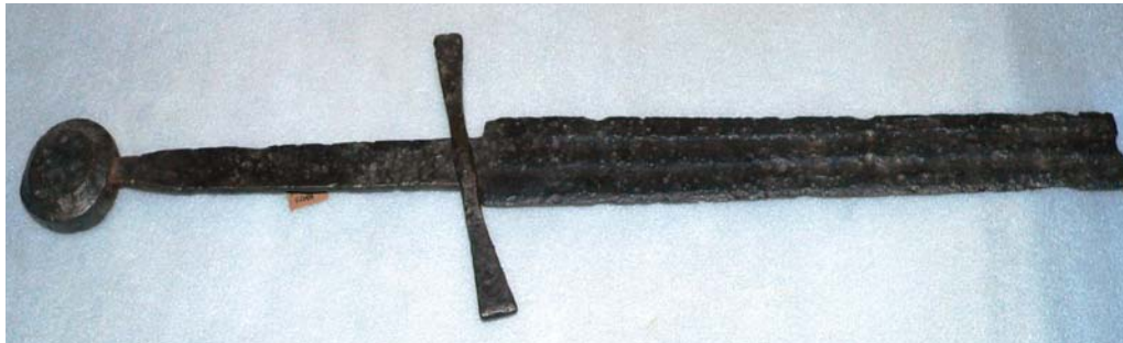
Рис. 2. «Великий» меч, др. пол. XIII – перша пол. XIV ст., НМІУ, інв. № 3–817.

1. Меч, др. пол. XIII – поч. XIV ст., інв. № 3–801 [аналогії див.: 10, Tabl. XXII, № 4; м/зн невід.] (рис 1).