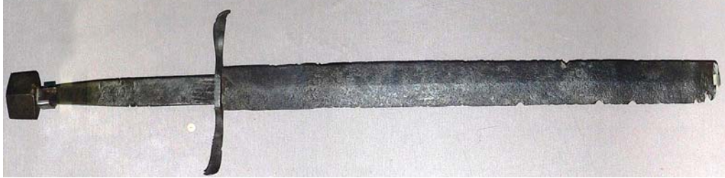
Рис. 4. Меч, XIV–XV ст., НМІУ, інв. № 3–1195.

Знайдений у 1918 чи 1919 р. поблизу с. Паланка* на Вінничині [3, арк. 147, акт вступу № 1218 від 9 травня; 17].