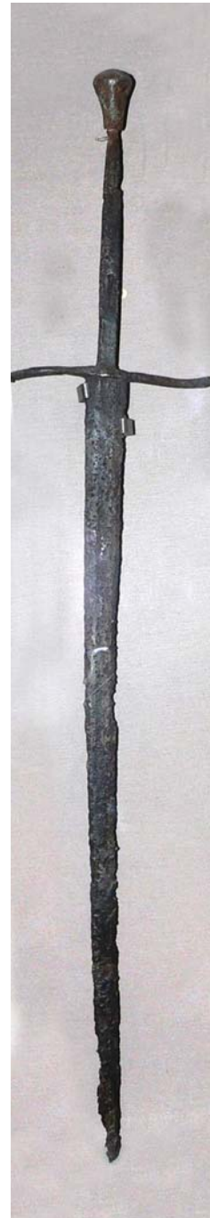
Рис. 7. Меч «бастард», др. пол. XIV–XV ст. НМІУ, інв. № 3–517.

Довжина 50 см. Однодольний клинок зберігся приблизно на \frac{3}{4} довжини. Руків'я розраховане на хват у «півтори руки». Хвостовик має форму бруска. «Яблуко» коркоподібної форми. Перехрестя рівне, круглого перерізу.