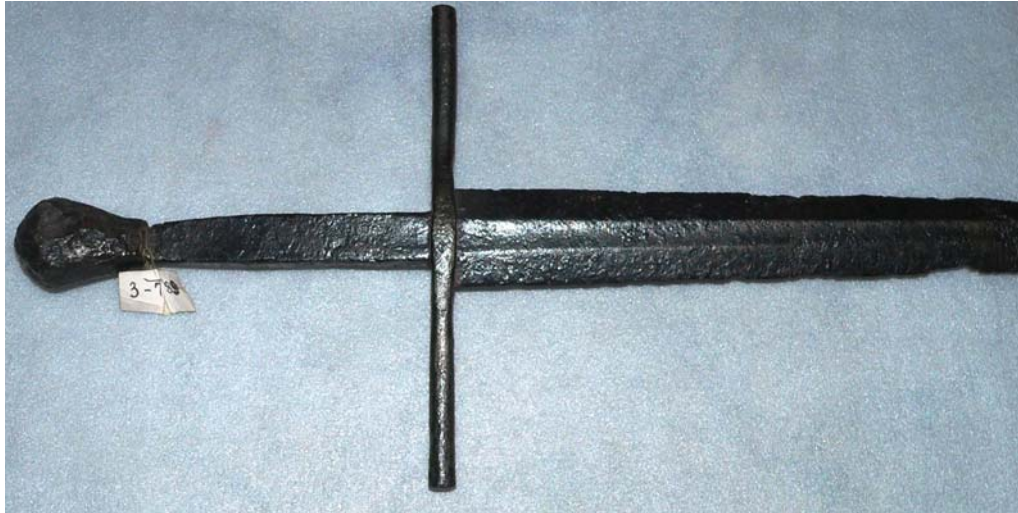
Рис. 8. Меч, XIV ст., НМІУ, інв. № 3-789.