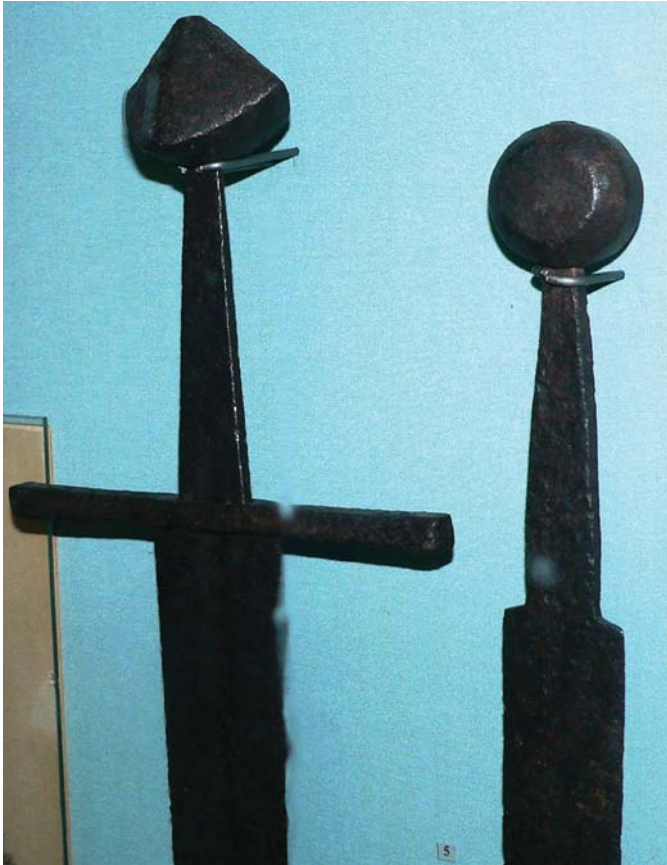
Рис. 3.1. Меч, др. пол. XIII – першої пол. XIV ст. НМІУ, інв. № В-1405.