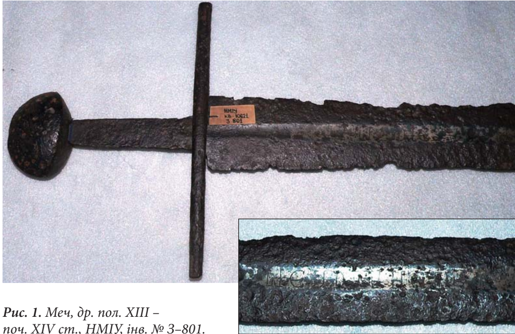
Рис. 1. Меч, др. пол. XIII – поч. XIV ст., НМІУ, інв. № 3–801.

чі датуються другою половиною XIII – першою половиною XV ст., при чому чотири з них є «романськими» і датуються другою половиною XIII – першою половиною XIV ст., решта п'ять – «готичними» мечами другої половини XIV–XV ст. [7, с. 48].