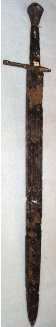
Рис. 6. Меч, др. пол. XIV–першої пол. XV ст. НМІУ, інв. № 3–805.