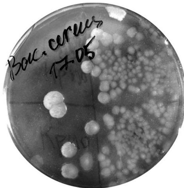
Рис. 3. Вплив змінного МП, заморожування (кріо) та їх спільної дії на ріст культури Bacillus cereus

де t — вік популяції чи індивідуума; c — нормуючий множник, який забезпечує, щоб сума