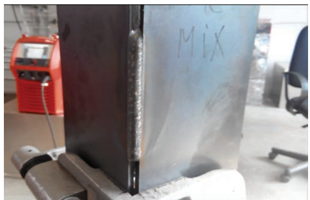
Сварка по зазору, корневой проход сварочный процесс LSC Root (положение PG), заполняющий — PMC-MIX (без колебаний, положение PF). Преимущества: стабилизация длины дуги, отсутствие брызг, высокая стабильность сварочной дуги