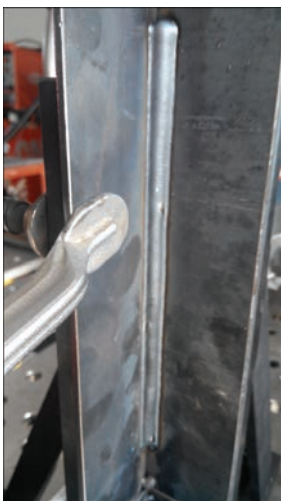
Вертикальный шов, сварка снизу-вверх (PF), сварочный процесс LSC Universal. Преимущества: стабилизация длины дуги и проплавления, отсутствие брызг, высокая стабильность процесса

♦ TPS/i Robotics — новое поколение роботизированных сварочных горелок Robacta Drive (новый уровень сервисного обслуживания от Fronius);