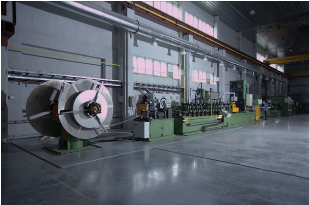
Рис. 1. Внешний вид трубоэлектросварочной линии (стан 10-60) в цехе по производству труб

Механические свойства исходного штрипса и труб определяли путем испытаний на растяжение.