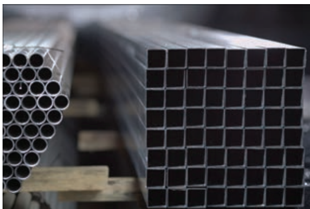
Рис. 4. Виды стандартной упаковки на экспорт нержавеющей труб квадратного и круглого сечения

Полученные результаты дают возможность утверждать, что сварные трубы производства ООО «АЛЬФА-ФИНАНС» (г. Днепропетровск) (рис. 4) по своим технологическим, механическим, антикоррозионным, металлографическим характеристикам практически ничем не уступают бесшовным трубам,