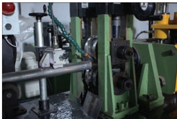
Рис. 3. Вихретоковый дефектоскоп контроля сплошности сварного шва и околошовной зоны (находится сразу после сварочного блока)

В данной работе для получения дополнительных сравнительных данных по коррозионной стойкости материала сварных труб (основной металл и зона сварного шва одной и той же трубы) в качестве экспериментальных выполнены исследования на питтинговую коррозию (ПК) в соответствии с основными положениями ГОСТ 9.912 и ASTM G 48. Образцы от труб выдерживали в агрессивном 10 %-м растворе: железа трихлорида гексагидрата ( \text{FeCl}_3 \cdot 6\text{H}_2\text{O} ) — 100 г соли на 900 см 3 дистиллированной воды, в течение 5 ч при температуре ~20 °С ( 19,5 \pm 0,5 °С). По окончании выдержки образцы промыли, просушили и оценили потерю их массы взвешиванием до и после выдержки в агрессивном растворе. Также анализировали состояние поверхности на наличие, размер, глубину питтингов и характер их расположения, особое внимание обращали на внутреннюю (рабочую) поверхность. В соответствии с традиционными представлениями подтверждено, что более подвержена ПК область сварного шва. В данном случае потеря массы образцов со швом 0,004...0,008 г незначительно превышает потерю массы образцов без шва 0,002...0,005 г. Однако в образцах с раскатанным швом «р» потеря массы 0,006...0,008 г оказалась большей, чем в образцах с внутренним гратом, т.е. без деформации шва «н»