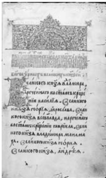
Ил. 2 – перерахування Великих князів Київських, починаючи з Володимира Великого, у «Руському Зографському пом'янику».

Проте, якщо про пожертви і дари українських гетьманів і козацької старшини до українських монастирів і навіть у такі центри східного християнства, як Константинополь, Єрусалим, Антіохію та Олександрію, на-