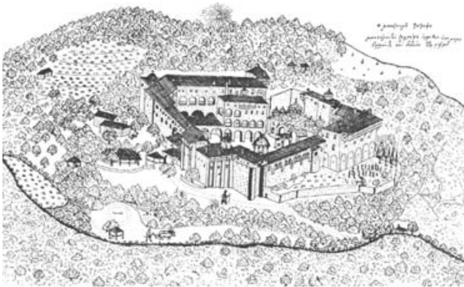
Іл. 6 – зображення болгарського монастиря Зограф на Афоні, 1744 р. Мал. В. Григоровича-Барського.