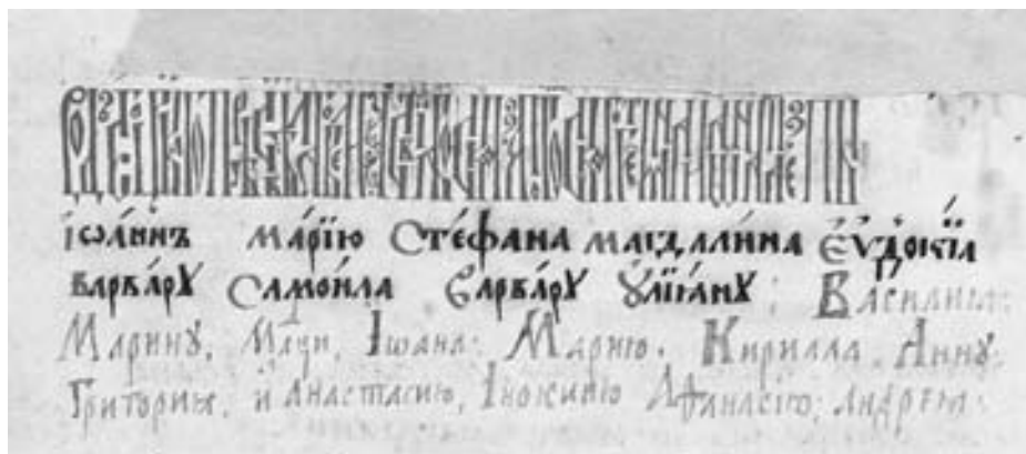
Іл. 4 – рід гетьмана Івана Мазепа у «Руському Зографському пом'янику».

Найпоширенішою у вітчизняній історіографії є думка, що Мазепа був одружений на старшій за нього заможній удові Ганні Фридрикевич. Проте достеменних джерел про це не збереглося. Це більше припущення, аніж доведений і беззаперечний факт. Уперше думку про одруження Мазепа на удові Фридрикевич висунув наприк. 70-х рр. XIX ст. український етнограф та історик М. Костомаров, але він не наводив жодного посилання на джерела, звідки ним запозичена така інформація 35 . У цій же праці Костомаров у довільній формі наводить і чимало інших не доведених фольклорних переказів, зокрема й ретельно описує як довершений факт відому легенду про прив'язання Мазепа до коня, яка не знайшла свого підтвердження у джерелах і була викрита істориками як пізніший художній вимисел 36 . Встановлено, що думку про одруження Мазепа на Ганні Фридрикевич М. Костомаров озвучив на підставі листування з О. Лазаревським, в якому той уперше висловив таке припущення 37 . При цьому сам Лазаревський посилався на усні перекази старожилів Конотоп та с. Смячі про те, що ці населені пункти у володіння «Мазепа отдал их своему пасынку