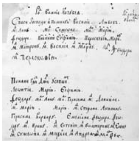
Іл. 5 – рід генерального судді Василя Кочубея у «Руському Зографському пом'янику».

У більшості українських тогочасних пом'яників після накладення за наказом Петра I анафами на Івана Мазепу сторінки з його іменем і родом виривалися та знищувалися. Зокрема, така доля спіткала навіть Пом'яник («Синодик милостинний») Руського Пантелеймонівського монастиря на Афоні, який містить імена і роди