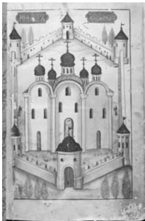
Лл. 1 – зображення болгарського монастиря Зограф на Афоні з «Руського Зографського пом'яника».