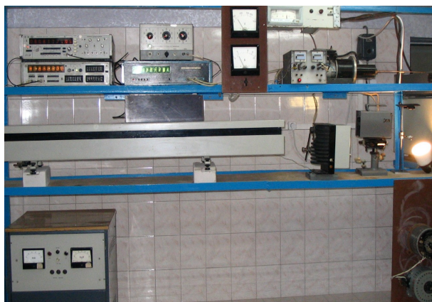
Рис. 2. Общий вид экспериментальной установки

Суть метода исследований заключается в том, что пластина (или пленка) ПМ нагревается от теплового источника (например, ламп накаливания или газоразрядных ламп высокого давления) и одновременно может подвергаться воздействию ЛИ.