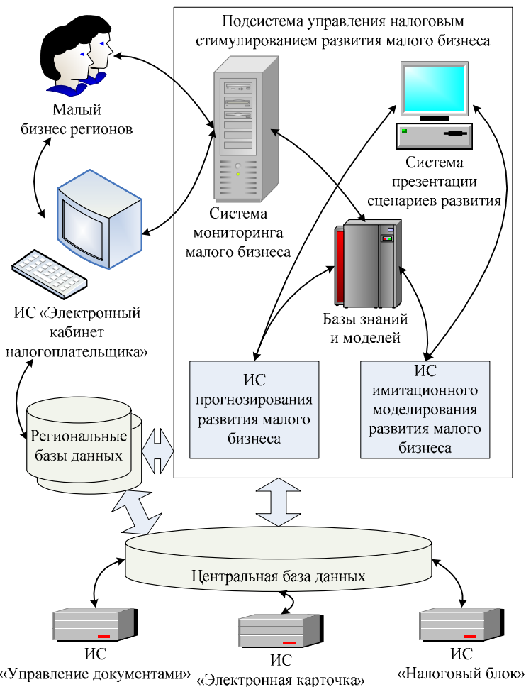
Рис. 3. Взаимодействие информационной системы управления налоговым стимулированием малого бизнеса с информационной средой ГФС

за пределы установленных интервалов создаются уведомления о необходимости проверки правильности реализации политики налогового стимулирования. В базе знаний и моделей содержатся правила обработки данных. База знаний представляет собой набор информации, охватывающей некоторую область знаний в структурированном виде, который пригоден для исполь- 216