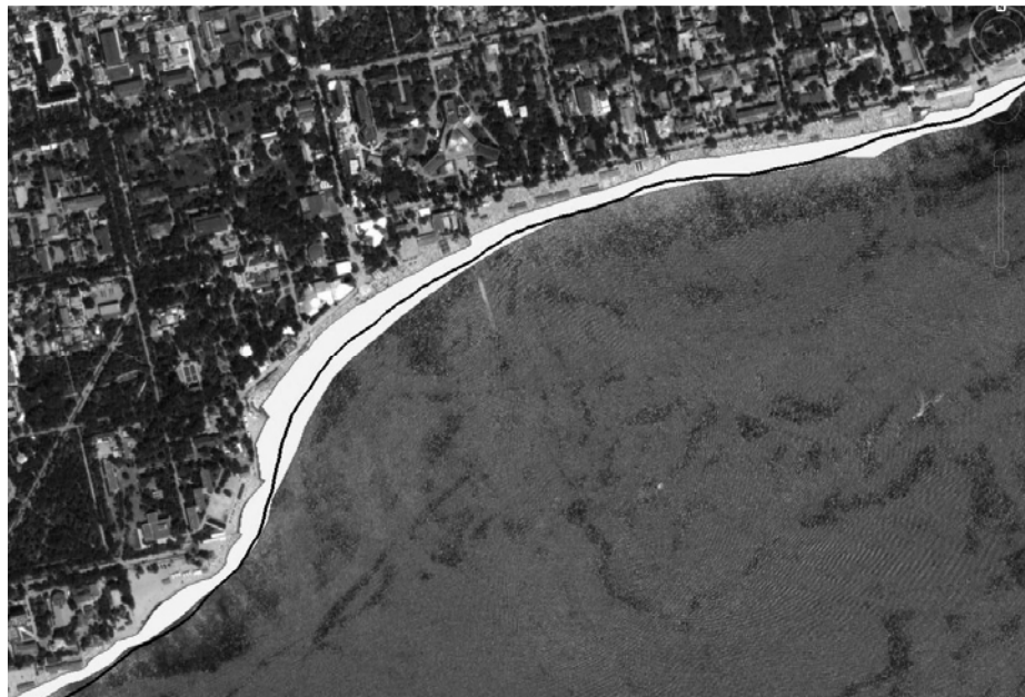
Р и с . 2 . Положение береговой линии 29 августа 1941 г. (мористая граница белого сектора), 16 июля 2010 г. (граница со стороны суши). Черной линией нанесено положение береговой линии на сентябрь 1967 г. (по данным топоъемки).

Ширина пляжей в 1941 г. составляла от 20 до 80 м. За прошедшие почти 70 лет наибольшие изменения произошли в районе от м.Карантинный до ул.Московской. Здесь среднее отступление береговой линии составило 32 м, а максимальное – 70 м (в районе городского пляжа «Курзал»). От