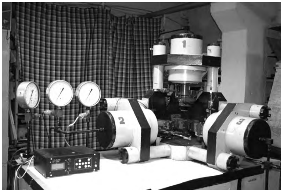
Рис. 1. Установка неравнокомпонентного трехосного сжатия

В соответствии с теорией, представленной выше, необходимо перейти к относительной плотности z = \rho_i/\rho_k , где \rho_i и \rho_k – плотность образца при данном значении давления одноосного нагружения и плотность матрицы угля (т.е. без пор):