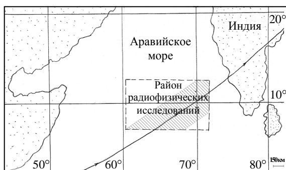
Рис. 3. Путь движения лунной тени в период солнечного затмения 16.02.1980 г.

В период проведения Институтом радиофизики и электроники НАН Украины комплексных радиофизических исследований в Индийском океане (февраль 1980 г.) произошло частное солнечное затмение [8]. На рис. 3 показан путь движения лунной тени, которая скользила по земной поверхности с запада на восток со скоростью около 1 км/с, прочерчивая узкую (диаметр лунной тени 270 км), но длинную (до 15 000 км) полосу. Внутренние касательные к Солнцу и Луне ограничивают конус полутени с радиусом около 35 000 км, откуда видно полное солнечное затмение. Если Солнце закрывается не полностью, продолжительность затмения может достигать до 2 ч (рис. 3).