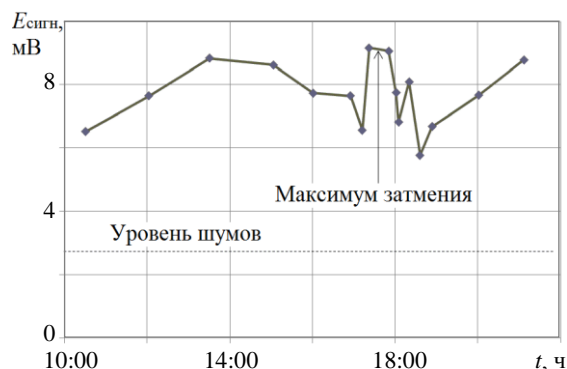
Рис. 1. Временная зависимость напряженности поля на трассе R = 39 км

тени и тени. На малых расстояниях (2÷10 км) изменения амплитуд отражений обнаружено не было. Большие изменения сигналов соответствуют и большим расстояниям.