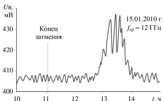
Рис. 5. Временная зависимость выходного напряжения детектора приемного устройства сигналов геостационарного ИСЗ

сигнал геостационарного искусственного спутника Земли (ИСЗ), который работал на средней частоте 12 ГГц и имел угол места \sim 30^\circ . Приемник сигналов состоял из антенны, конвертора спутникового телевидения, к входу которого был подключен широкополосный усилитель и амплитудный детектор. Выходной сигнал измерялся с помощью вольтметра и записывался самописцем. На рис. 5 показана временная зависимость выходного напряжения детектора в момент солнечного затмения и после него. Как видно из рис. 5, в момент солнечного затмения не отмечены изменения уровня сигнала, который имел обычную величину в пределах 405–408 мВ. После окончания солнечного затмения (11:18) уровень сигнала также оставался неизменным до 12:50. Затем уровень сигнала начал возрастать и достиг максимальной величины в пределах 430–440 мВ ( \sim 13:30 ). В 14:00 сигнал упал до прежней величины 405–408 мВ. Кроме этого, к выходу амплитудного детектора был подключен спектроанализатор. Анализ полученных спектров не показал каких-либо отличий от обычных спектров, соответствующих данным метеорологическим условиям.