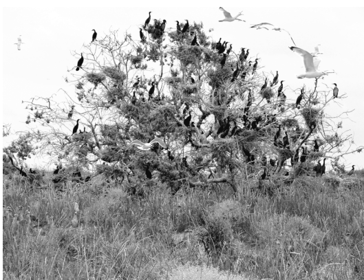
Рис. 1. Гнезда Phalacrocorax carbo на лохе узколистном (Ейская коса).

В период экспедиционных исследований в 2009 г. на острове Ейской косе обнаружено многотысячное скопление больших бакланов, которые построили гнезда на деревьях (рис. 1). Птицы выбирали древесную растительность независимо от размеров, в том числе