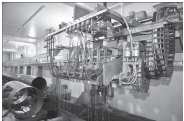
Рис. 3. Установка для ультразвукового контроля основного металла и сварного соединения трубы

Антикоррозионные покрытия наносят на наружную поверхность труб диаметром от 114 до 530 мм, прошедших полный технологический цикл и признанных годными в ходе приемки. Изоляционные материалы применяют после проведения предварительных сертификационных испытаний. В зависимости от требований заказчика