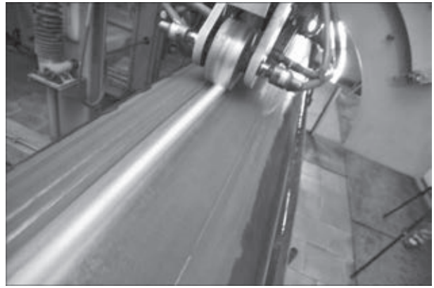
Рис. 2. Локальная термическая обработка сварного соединения трубы

Внедрена автоматизированная система прослеживаемости, учета производства и контроля качества продукции. Новое оборудование позволяет проводить документирование технологических параметров процесса производства труб с привязкой к номеру каждой трубы. Фиксируют-