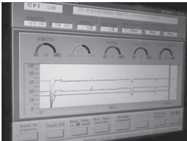
Рис. 1. Контроль параметров высокочастотной сварки трубы пайп НМТЗ». Модернизация технологического оборудования проведена с учетом передового зарубежного опыта и рекомендаций ИЭС им. Е. О. Патона. Новое технологическое оборудование поставлено предприятиями Австрии, Великобритании, США, ФРГ, Франции, Кореи, Голландии и Чехии.

В линии трубоэлектросварочного стана 159-530 модернизированы участки подготовки боковых кромок, формовки, сварки и удаления наружного и внутреннего грата, введена локальная термическая обработка сварного соединения. Организованы участки современного неразрушающего контроля и наружного антикоррозионного покрытия труб, введена автоматизированная система информационного обеспечения. Освоено производство труб дюймового ряда диаметром 355,9; 406,4; 508 мм и усовершенствована калибровка труб диаметром 530 мм.