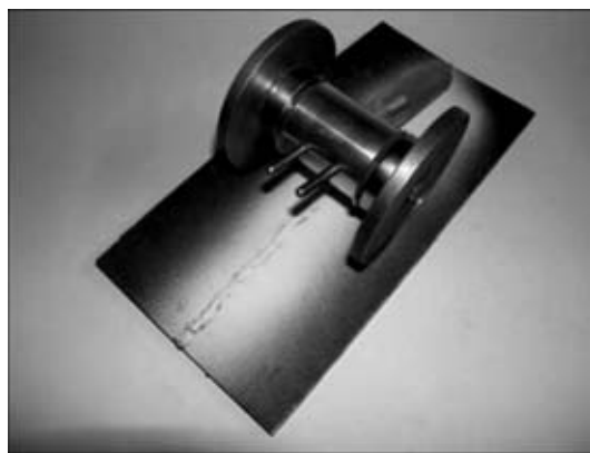
Рис. 4. Общий вид передвижного НУ ЭМ-2 при МПК участка сварного соединения

Оценка качества НУ на постоянных магнитах. Независимо от типа НУ и его сложности главное внимание при их изготовлении необходимо обращать на качество НУ и применяемого магнитного индикатора (порошок, магнитографическая лента, металлическая полоса при магнитооптическом методе).