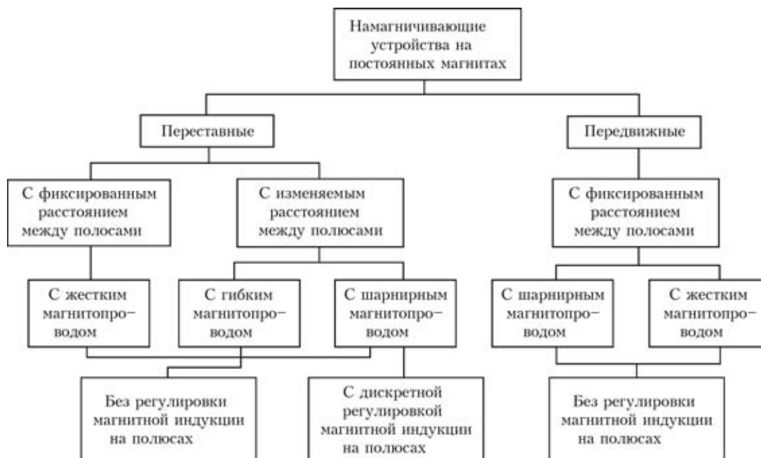
Рис. 1. Классификация НУ на постоянных магнитах

и исследованию таких НУ проводятся с восьмидесятих годов прошлого столетия. Одной из первых разработок ИЭС им. Е. О. Патона было переставное НУ типа ЭМ-1 с фиксированным расстоянием между полюсами за счет соединения их жестким П-образным магнитопроводом, в котором отсутствовали какие-либо звенья для изменения углов и расстояний между полюсами. Более универсальным явилось НУ ЭМ-1м с гибким магнитопроводом между полюсами в виде тросовой перемычки. С помощью такого устройства легко реализуется способ полюсного продольного, поперечного и нормального намагничивания деталей сложной по конфигурации формы.