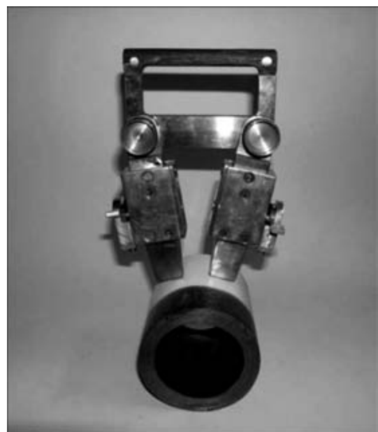
Рис. 3. Общий вид переставного НУ ЭМ-13 при МПК детали в виде фрагмента трубы

Для проведения магнитного контроля передвижное НУ устанавливается таким образом, чтобы ось магнитопровода располагалась перпендикулярно оси сварного шва. Перемещение НУ по контролируемой поверхности изделия осуществляется без особых усилий с помощью рукоятки оператором-дефектоскопистом, что позволяет одновременно с перемещением НУ непрерывно выполнять операцию полива контролируемой поверхности магнитной суспензией. После окончания контроля для снятия устройства с ферромагнитной поверхности рукоятку НУ необходимо повернуть вертикально относительно его оси до контакта упоров с поверхностью изделия. При дальнейшем повороте рукоятки произойдет отрыв НУ от поверхности. Отрыв с помощью упоров снижает усилие отрыва в l_1/l_2 раз, где l_1 — длина ручки НУ; l_2 — длина упоров.