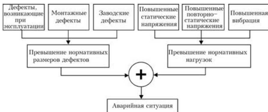
Рис. 1. Факторы, вызывающие аварийную ситуацию на технологических трубопроводах «высокой стороны» ДКС

Несомненный интерес представляет опыт обеспечения надежной эксплуатации трубопроводов, проложенных в условиях вечной мерзлоты, накопленный в газодобывающей компании ООО «Уренгойгазпром».