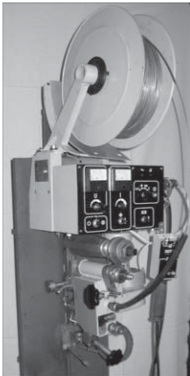
Рис.1. Внешний вид аппарата А-1150К

ронные схемы управления двигателями приводов перемещения аппарата и подачи электродной проволоки. Изменение скорости вращения двигателей осуществляется с помощью простой схемы без каких-либо обратных связей. При такой системе управления теряется большая часть мощности двигателей, особенно при работе двигателей на малых оборотах. Кроме того, отсутствует возможность визуального контроля за скоростью сварки и скоростью подачи электрода при подготовке аппарата к работе и в процессе сварки. Определенное неудобство управления аппаратом связано со спецификой выполнения процесса сварки с принудительным формированием: процесс требует постоянного визуального контроля за положением сварочной ванны относительно верхнего края формирующего ползуна. Эта задача решается путем подбора скорости перемещения аппарата с помощью резистора, который традиционно располагается на пульте управления. Естественно, при поиске резистора сварщик вынужден кратковременно оставлять без внимания зону сварки, что может способствовать появлению дефектов в шве.