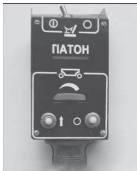
Рис. 3. Малогабаритная пульт-ручка аппарата А-1150К

На лицевой панели пульта управления (рис. 2) расположены элементы управления процессом сварки: тумблер и световой индикатор «СХЕМА ВКЛЮЧЕНА»; амперметр для контроля тока сварки; вольтметр для визуального контроля напряжения на дуге U_d , скорости подачи электродной проволоки v_s , скорости сварочной тележки v_T ; кнопка контроля наличия защитного газа; переключатель для задания контролируемого параметра; два переключателя для задания направления