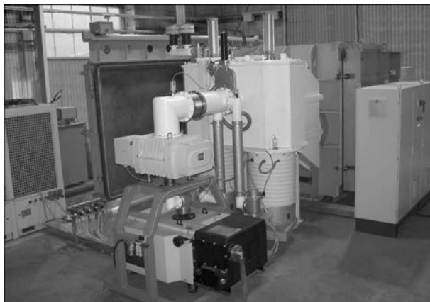
Рис. 3. Вакуумная система откачки установки ЭЛУ-20 с автономным водяным охлаждением вакуумных насосов, ЭЛП и источника питания (чиллер типа BL365-16, фирма «Lahntechnik», Германия)

Для получения изображения места сварки на мониторе АСУ в режиме реального времени применена аппаратура видеонаблюдения РАСТР. Изображение поверхности свариваемого изделия формируется по сигналам от датчика вторично-эмиссионных электронов, установленного на ЭЛП в непосредственной близости от места сварки (рис. 2). Четкая картина сварочного процесса с образованием лицевого валика шва отображается