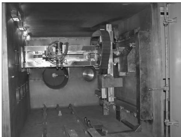
Рис. 2. Блок доработанной сварочной ЭЛП с механизмами перемещения по координатам X , Y , Z и наклоном по координате VG

Вакуумная система откачки установки, разработанная и созданная на базе современного вакуумного оборудования, обеспечивает необходимое разрежение в сварочной камере и электронно-лу-